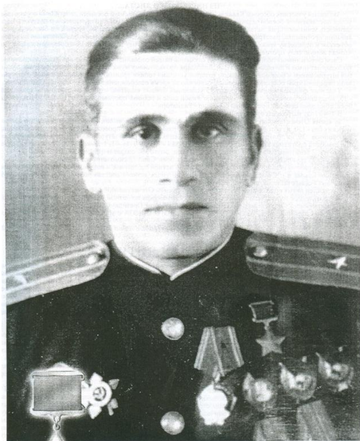
ВОЙТЕНКО СТЕФАН ЕФИМОВИЧ

ГЕРОЙ СОВЕТСКОГО СОЮЗА 27.06.1909 - 2.04.1993 гг., ст. Ладожская