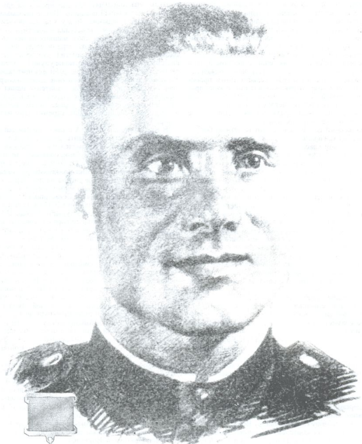
ЛЕБЕДЕВ АНАТОЛИЙ ТИМОФЕЕВИЧ

ГЕРОЙ СОВЕТСКОГО СОЮЗА 30.09.1916 - 26.02.1948 гг., ст.Ладожская