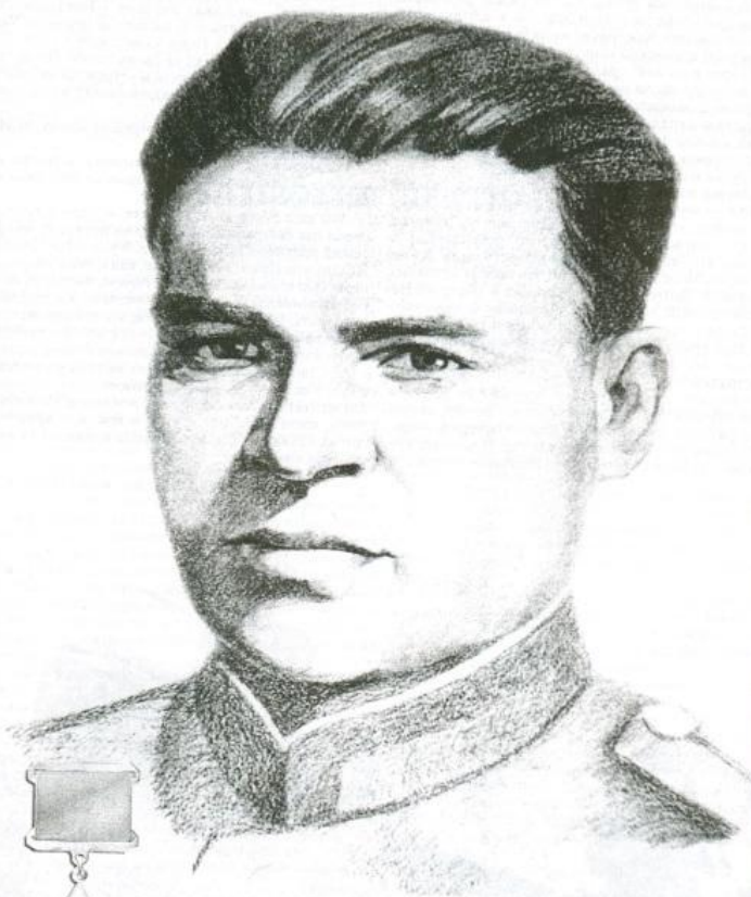
СТРИЖАК ВЛАДИМИР СТЕПАНОВИЧ

ГЕРОЙ СОВЕТСКОГО СОЮЗА 12.12.1911 - 30.12.1983 гг., г. Усть-Лабинск