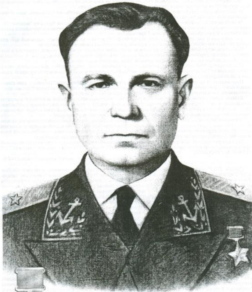
СТРЕЛЬНИКОВ ВАСИЛИЙ ПОЛИКАРПОВИЧ

ГЕРОЙ СОВЕТСКОГО СОЮЗА 28.03.19... - 23.10.1993 гг., ст.Кирпильская