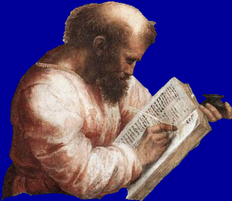
Пифагор (VI в. до н.э.)