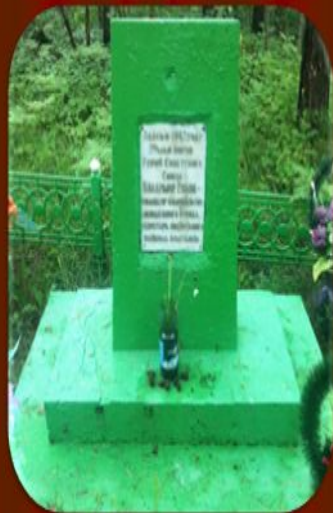
Героя Советского Союза Владимира Самсоновича Рябка