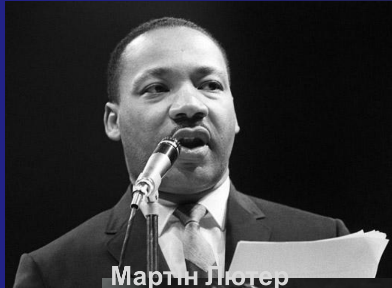
Мартін Лютер Кінг