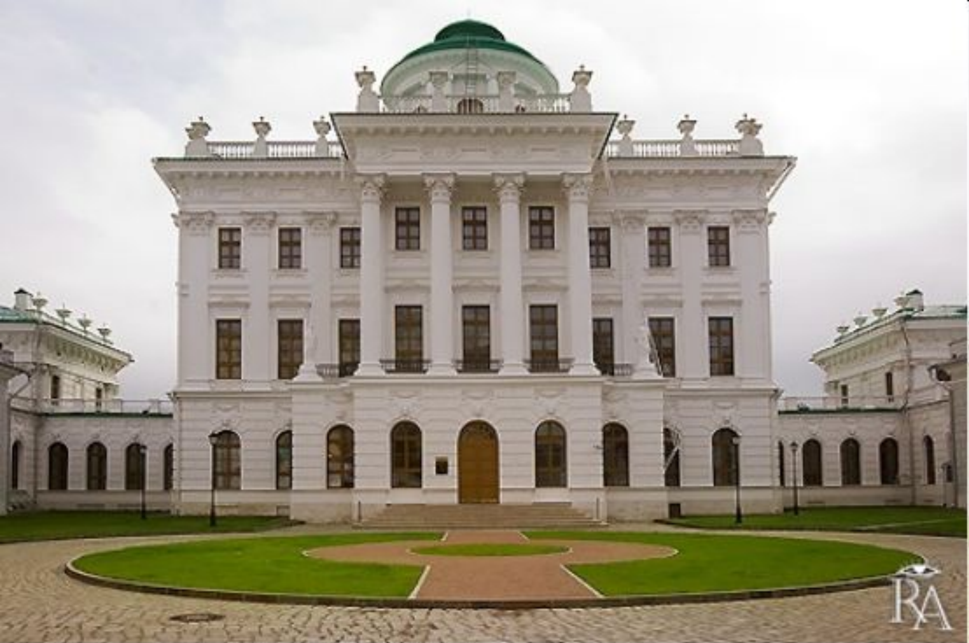
Дом Пашкова Фасад.