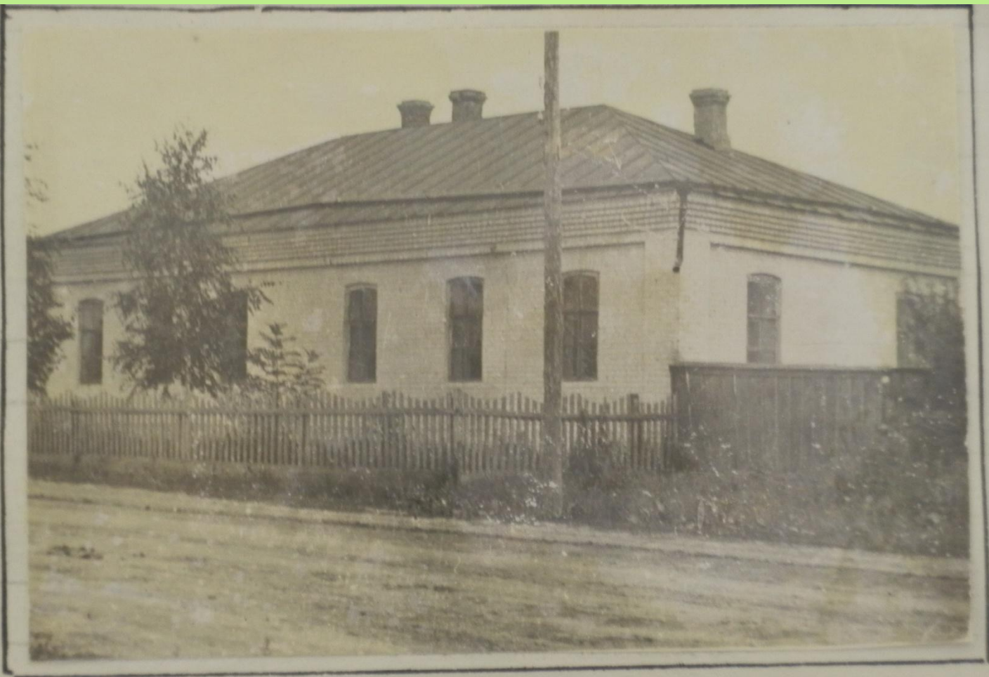
с. Курмыш. Первое каменное здание, где помещается ветляхобница.