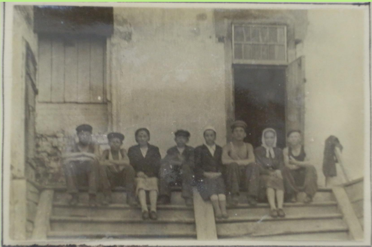
с. Курмыш. Группа юных краеведов во время отдыха в сред. школе.