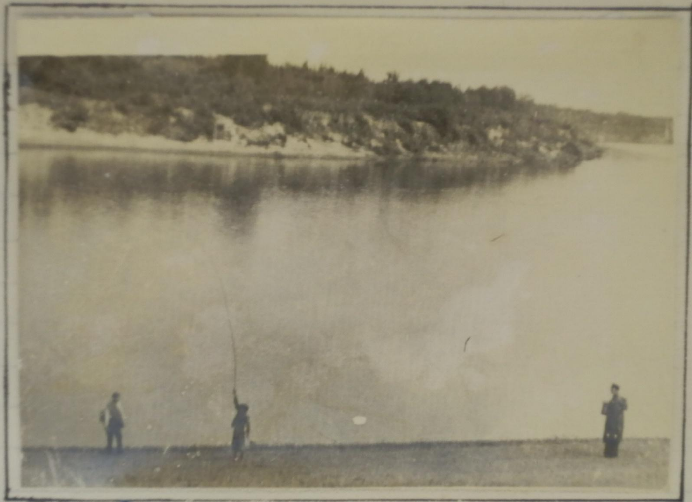
Лени и правий берега р. Сури.