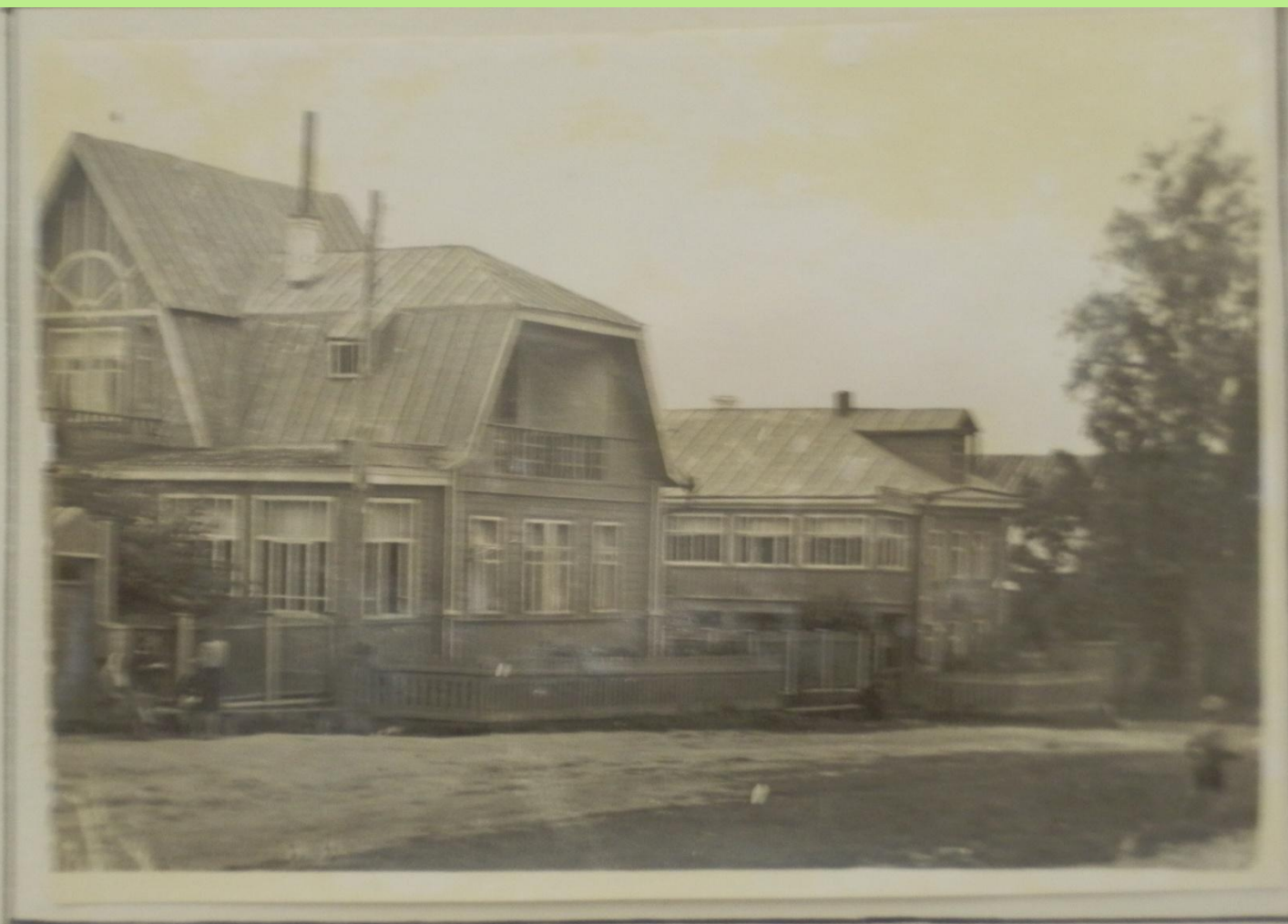
п. Васильсурск. Домотдника № 1.