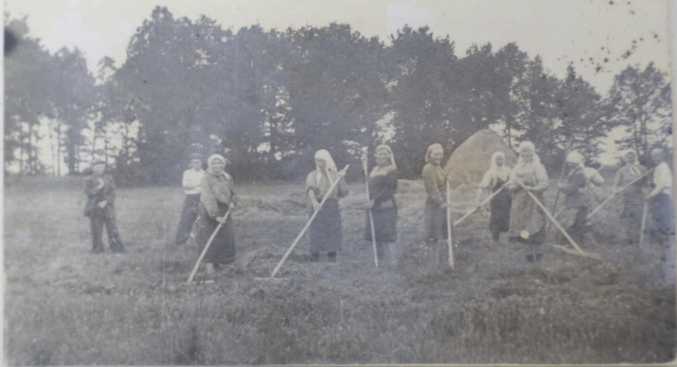
Сенокос на пойме р. Сурь. Кур- мышский район.