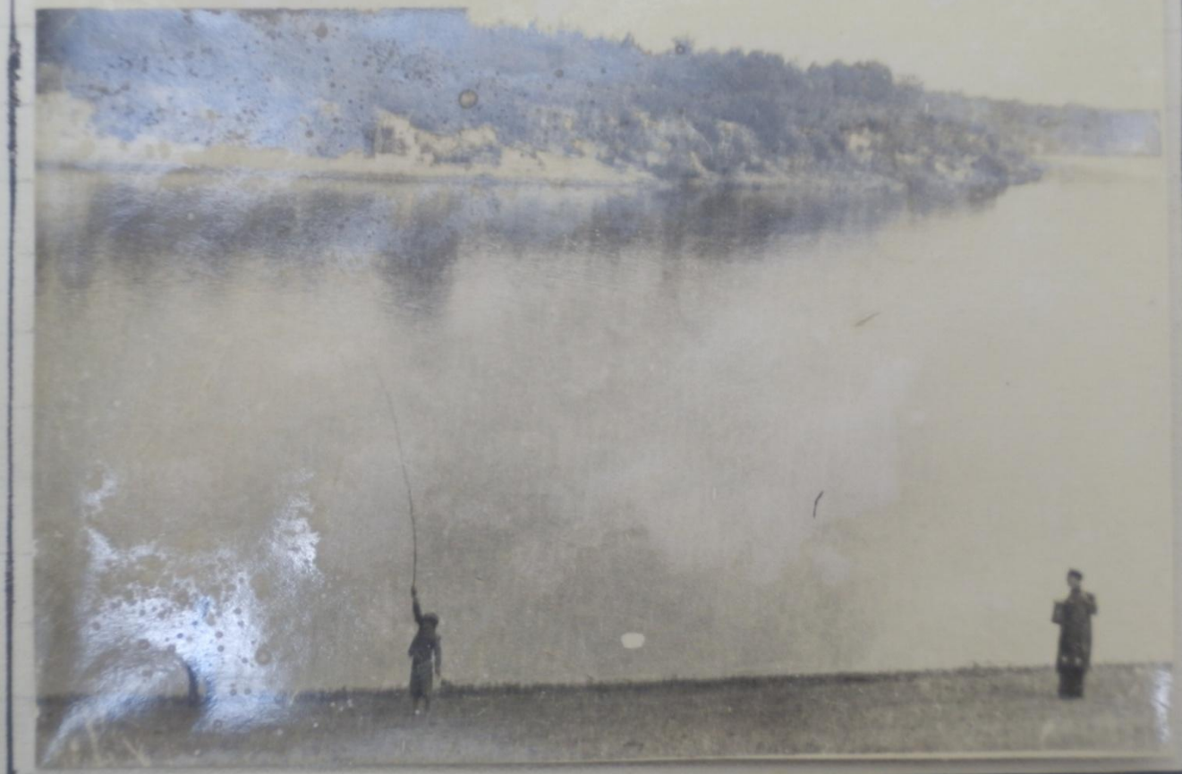
Лени и правий берега р. Сури.