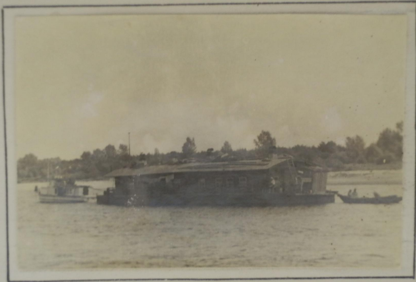
р. Сура в р-не Княжићи.