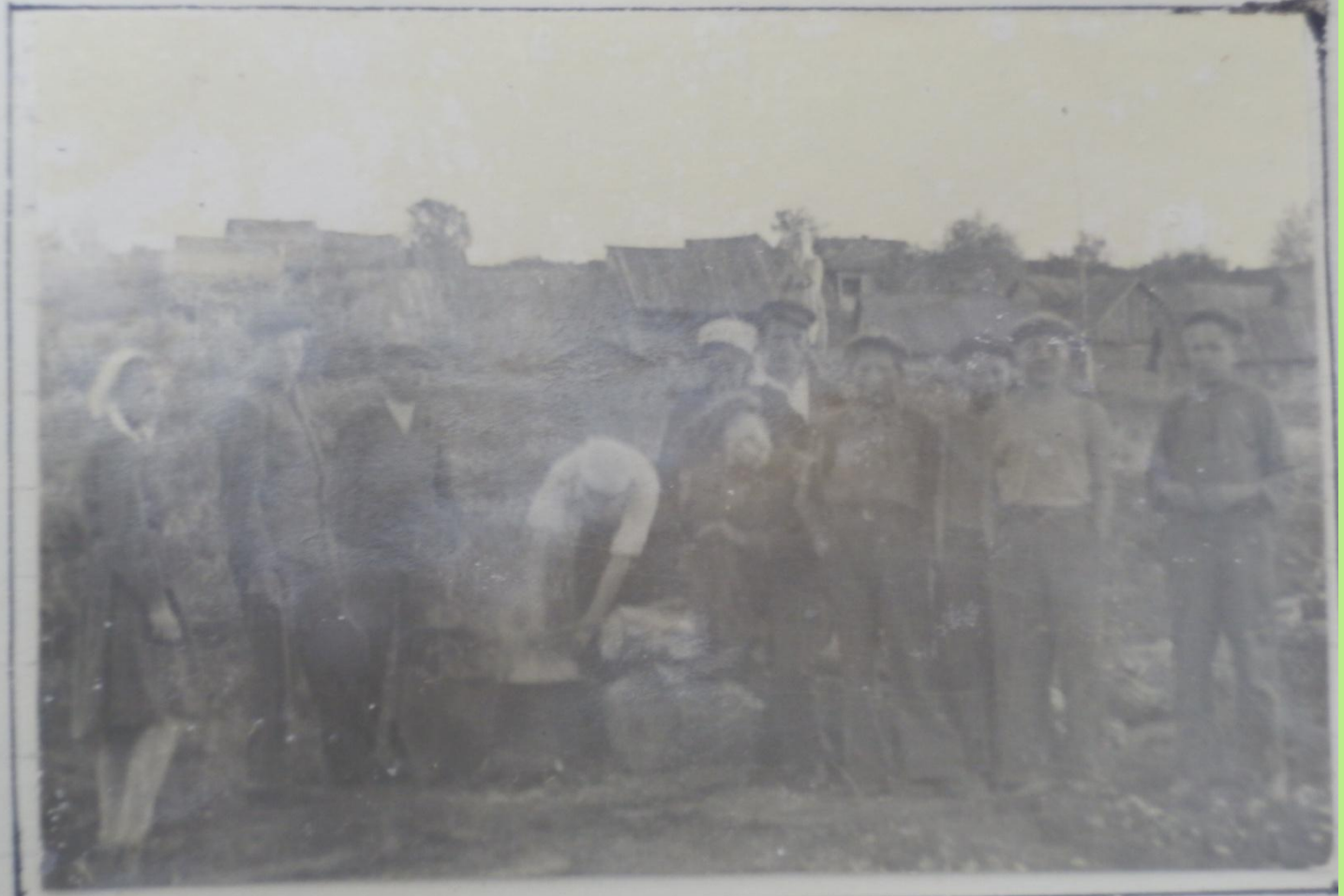
д. Козловка. Краеведы перед утником.