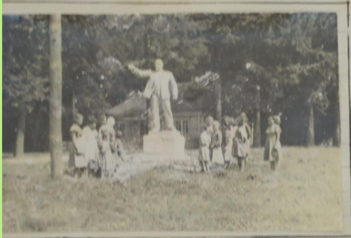
Воспитанни- ки Сурского дет- ского дома у памят- ника Ленину.