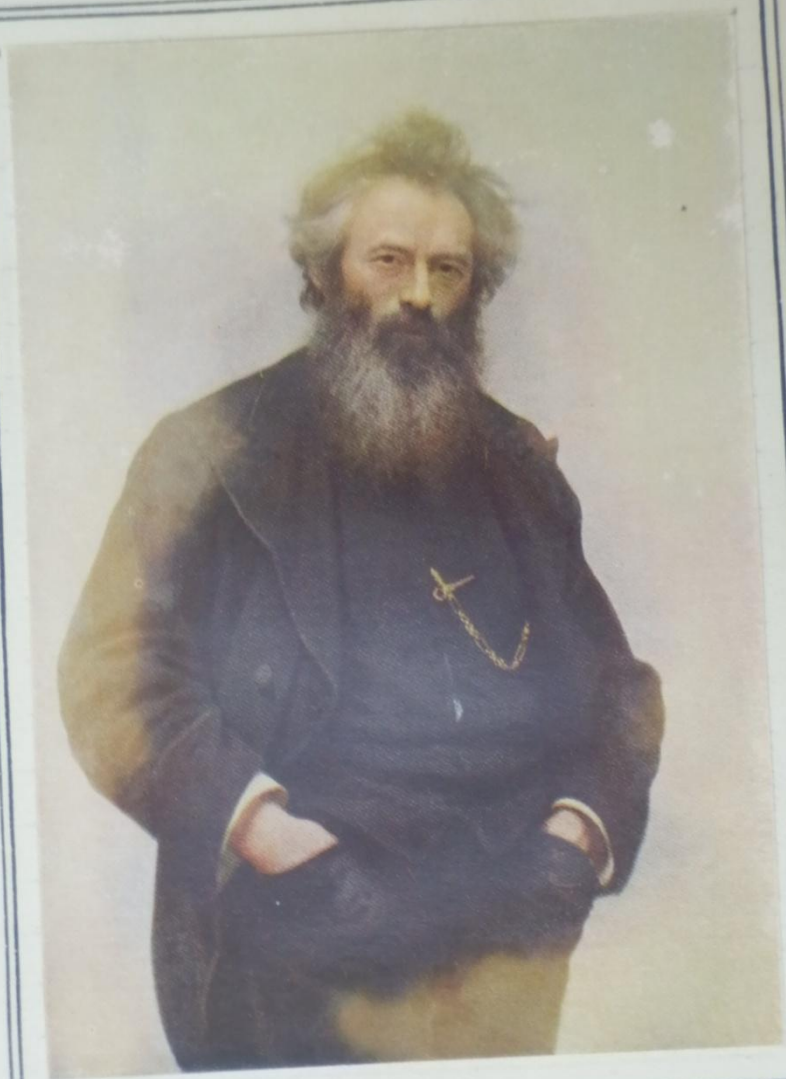
Великий русский художник Иван Иванович ШИШКИН.