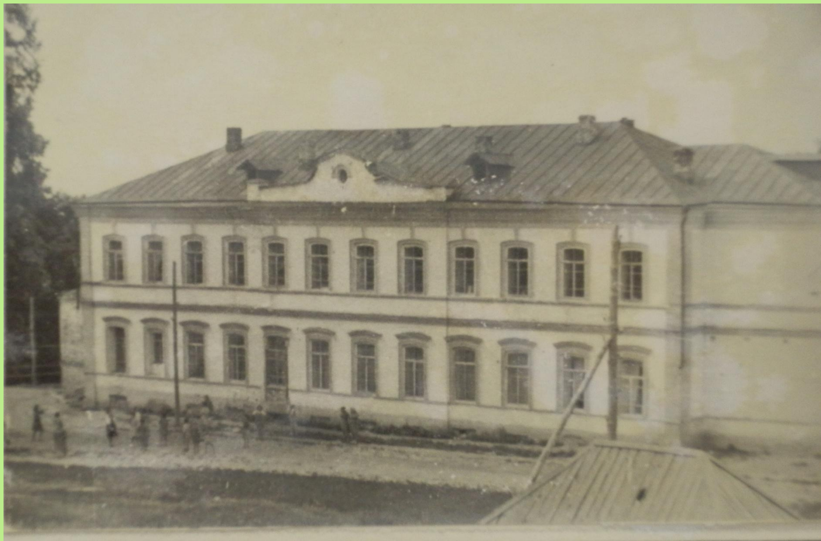
Столовая Сурского детдома.