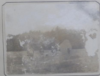
... так они и шли ...

Над Родиной нашей чудесной Счастлирое утро встает. С веселой и радостной песней Уходят ребята в поход.