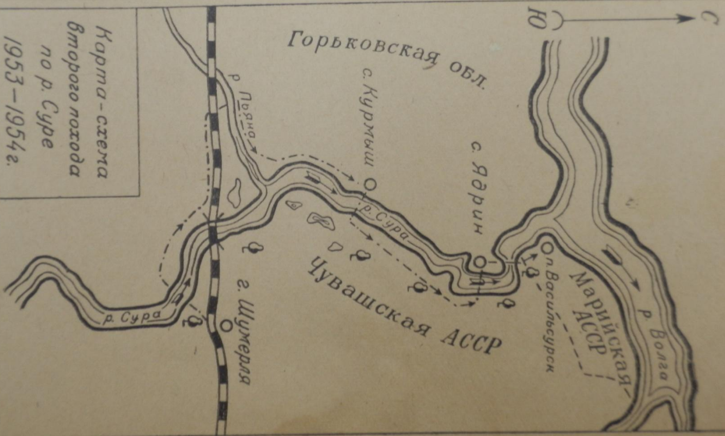
Карта-схема Второго похода по р. Сура 1953—1954 г.