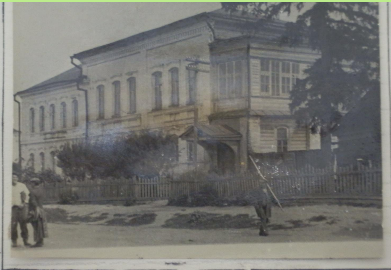
с. Курлыш. Дом, где помещается Райисполком и Райком КПСС.