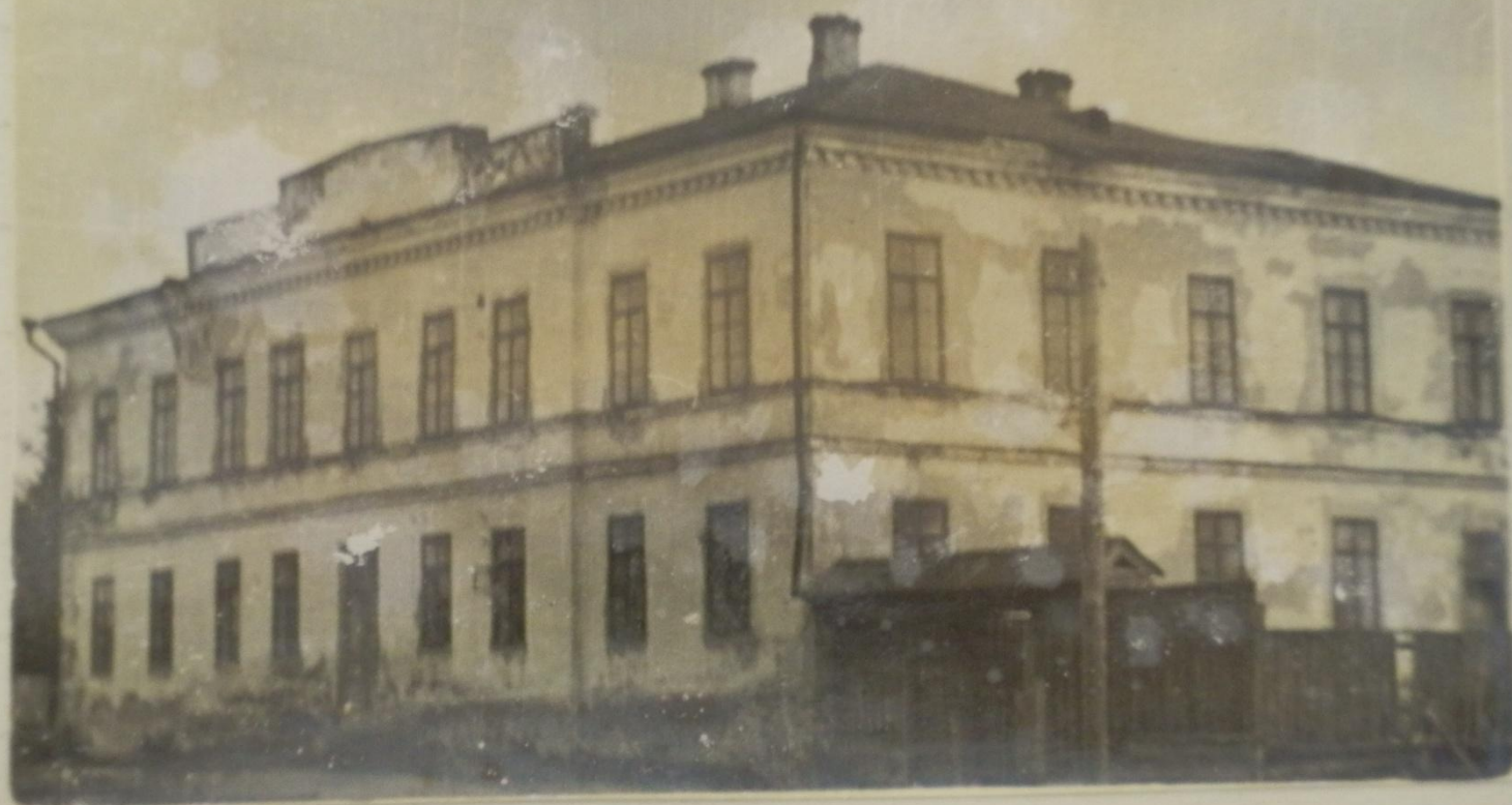
Здание Курмышского Государственного казначейства, где помещается с. школа.