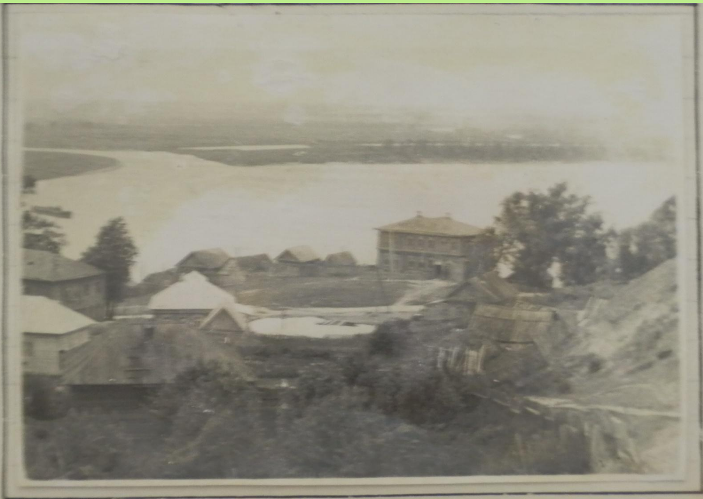
Слияние Волги и Суры у п. Васильсурска. Слева - Сура, справа - Волга.