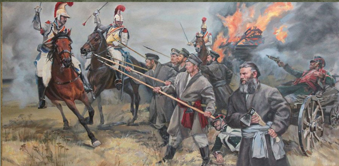
Народное ополчение в 1812г.