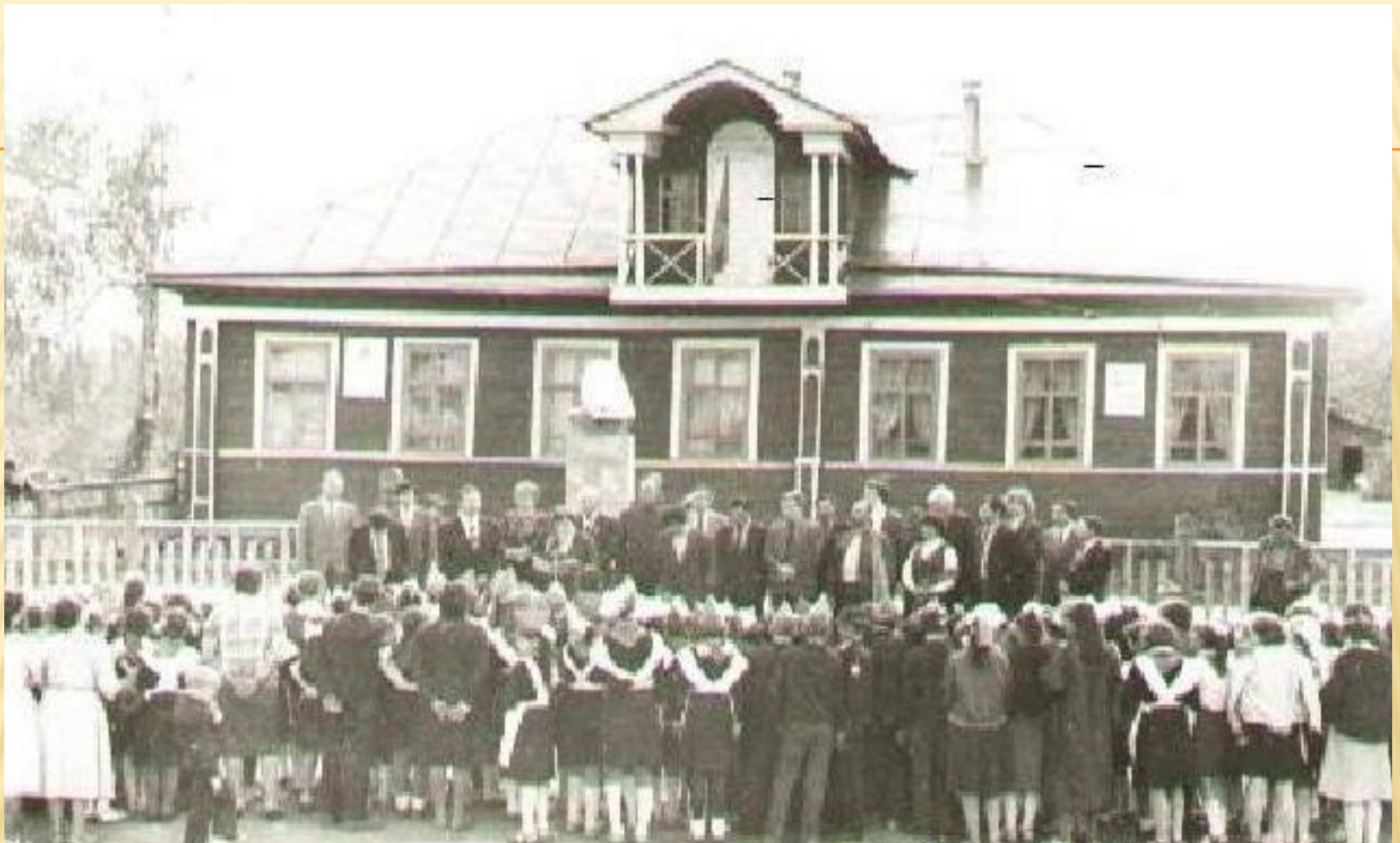
Пандиковское начальное народное училище открыто 4 марта 1870 года по ходатайству инспектора народных училищ Симбирской губернии Ильи Николаевича Ульянова.