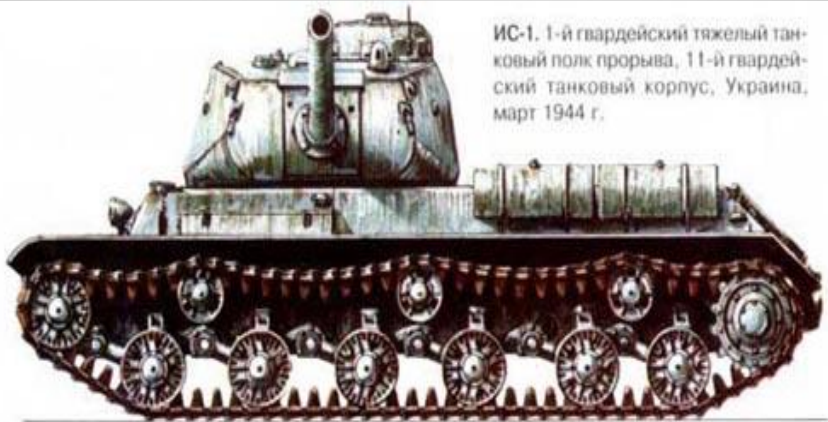
ИС-1. 1-й гвардейский тяжелый танковый полк прорыва, 11-й гвардейский танковый корпус, Украина, март 1944 г.