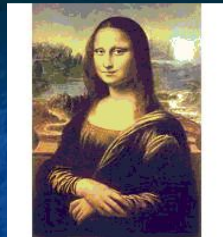
Леонардо да Винчи. «Мона Лиза».

РАФАЭЛЬ САНТИ (Raffaello Santi) (1483-1520), итальянский живописец и архитектор. Представитель Высокого Возрождения.