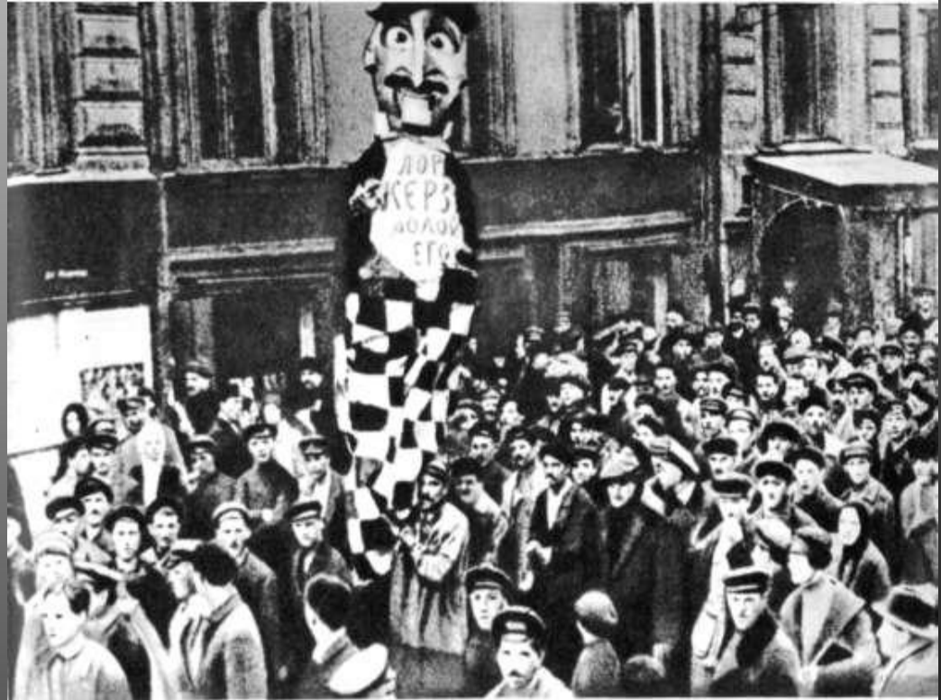
Демонстрация в Москве против ультиматума Керзона