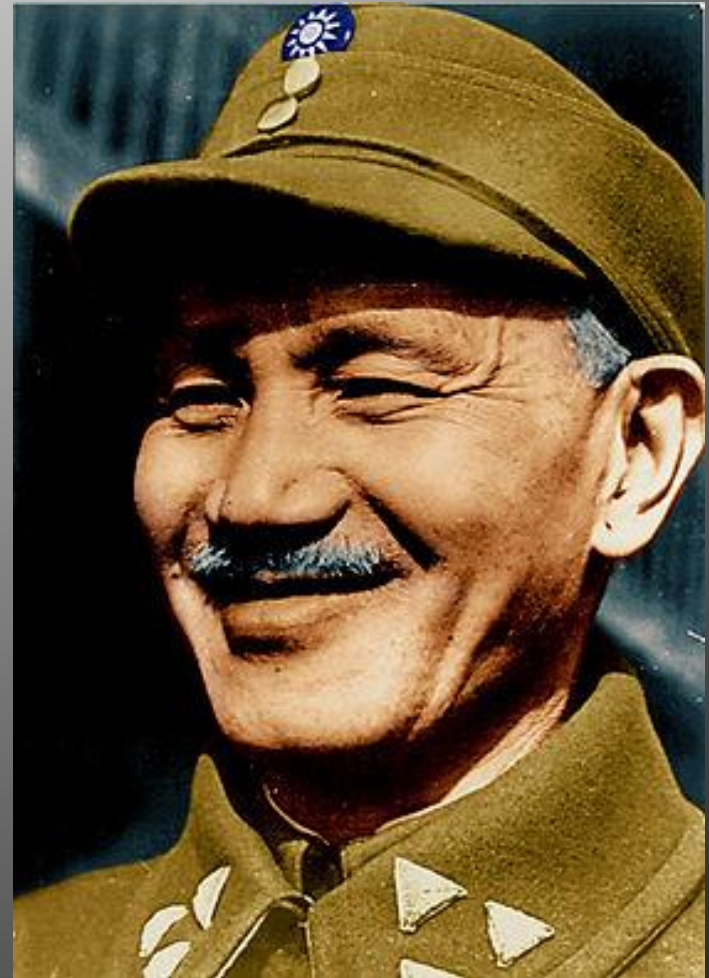
Чан Кайши в 1928 г. был избран президентом Китая.

В 1924 г. было подписано советско-китайское соглашение об установлении дипломатических отношений. Советское правительство отказывалось от всех привилегий царского правительства в Китае. Соглашение также предусматривало совместное управление советской и китайской администрацией на Китайско-Восточной железной дороге (КВЖД), построенной на русские деньги на китайской территории.