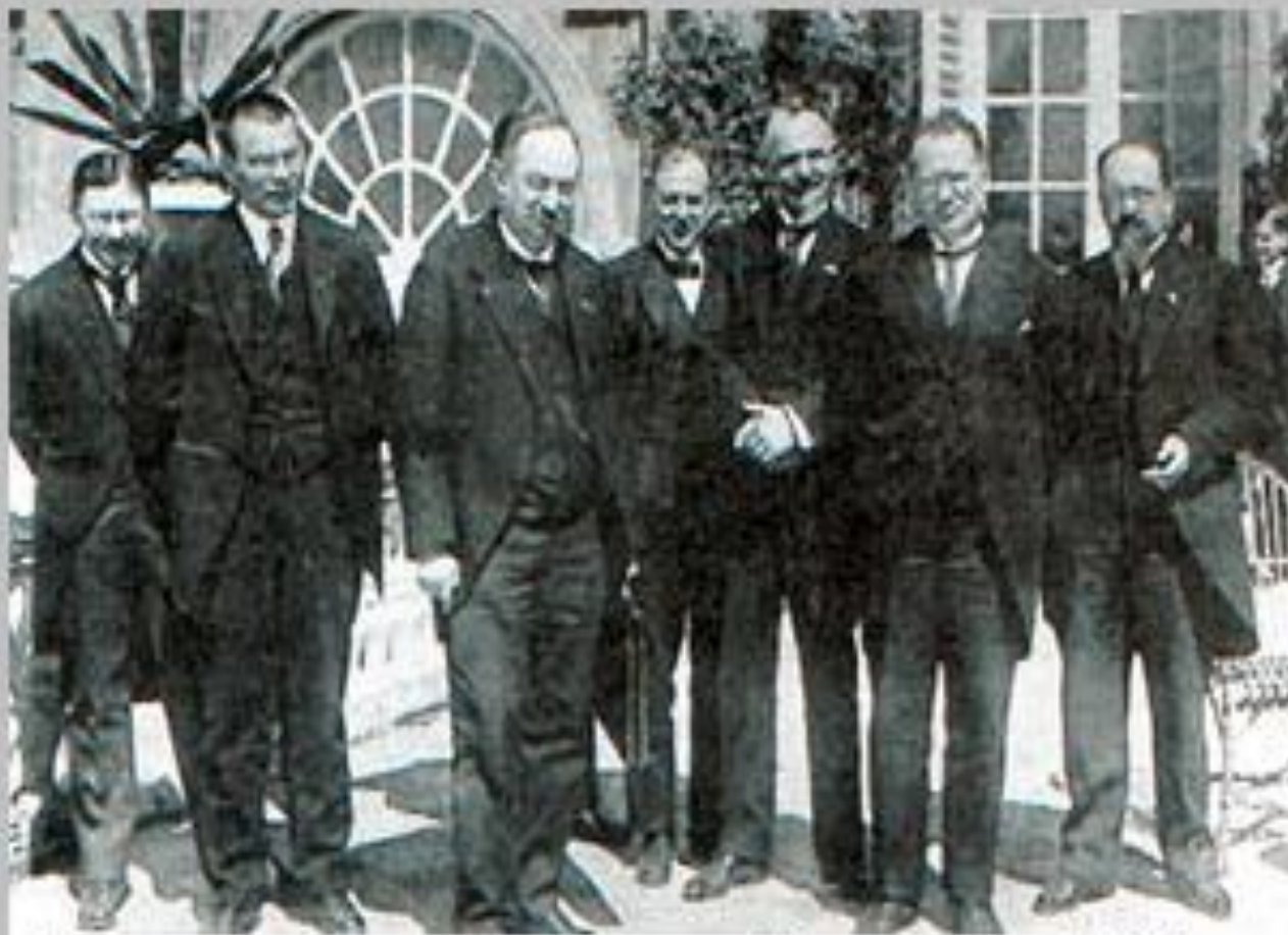
Генуэзская конференция. 10 апреля 1922 г.

РСФСР предложила сотрудничество между капиталистическими и социалистическими государствами в экономической, политической и культурной областях, невмешательства во внутренние дела, признания принципов ненападения, полного