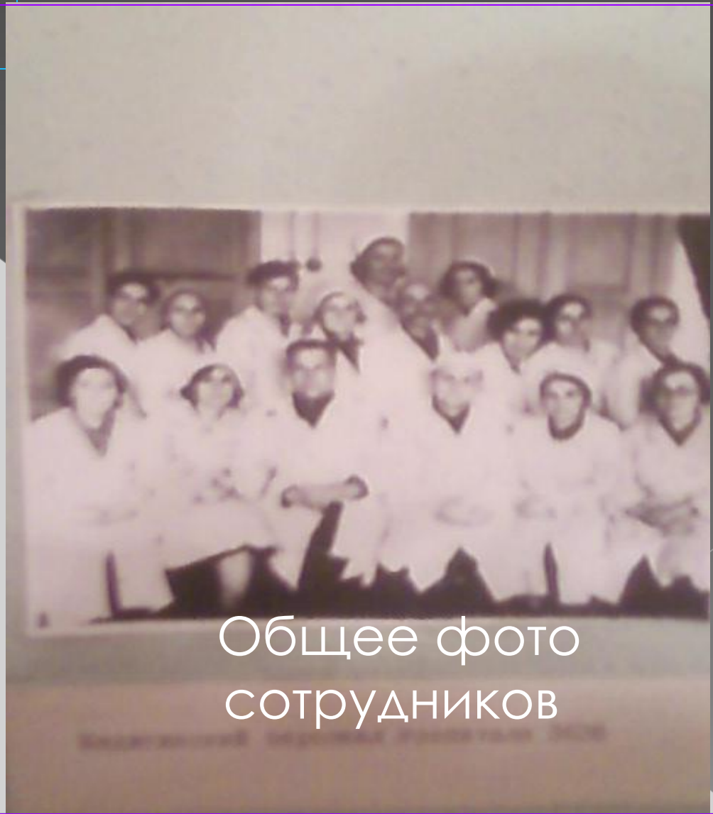
Общее фото сотрудников