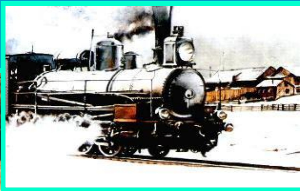
На транссибирской Железной дороге.