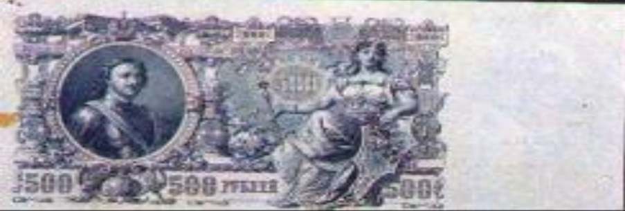
Банкноты конца XIX века.