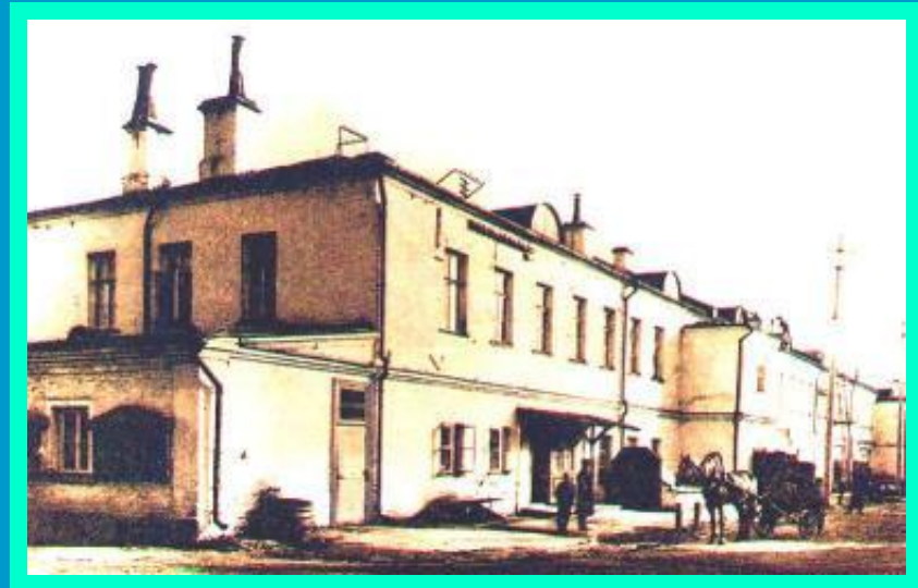
Завод братьев Мамонтовых