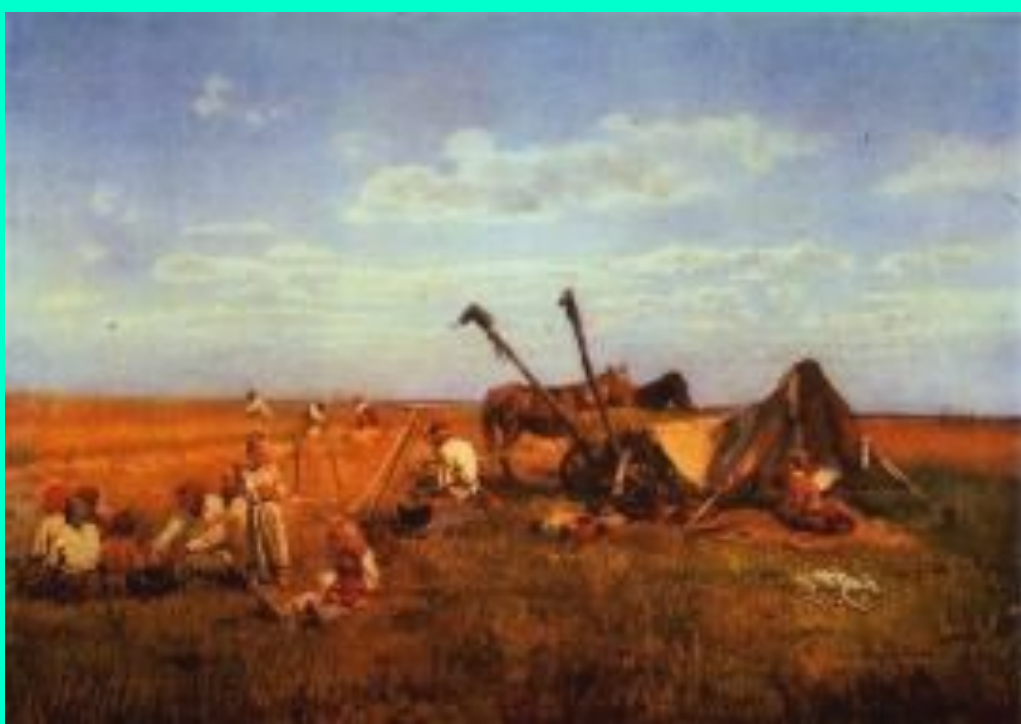
В.Маковский. Отдых во время сбора урожая.