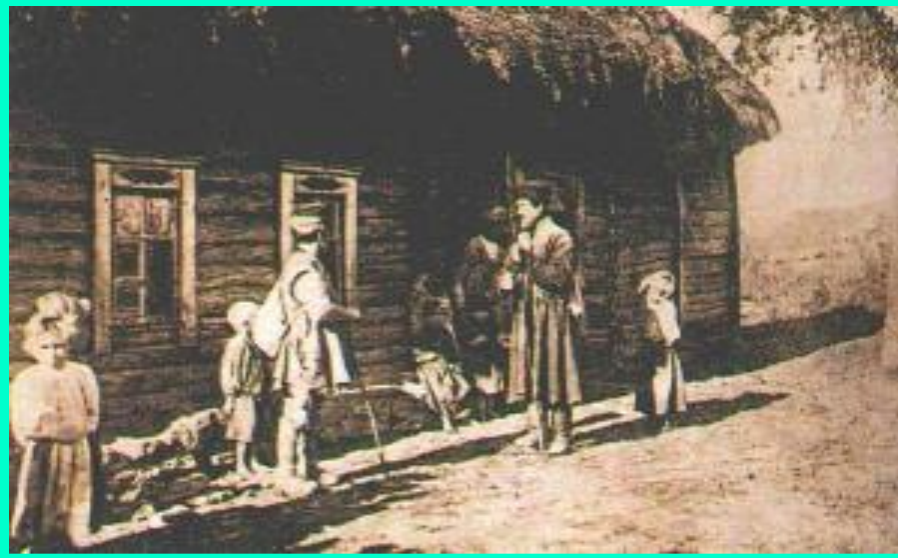
Крестьянский дом. (фото 19 века.)