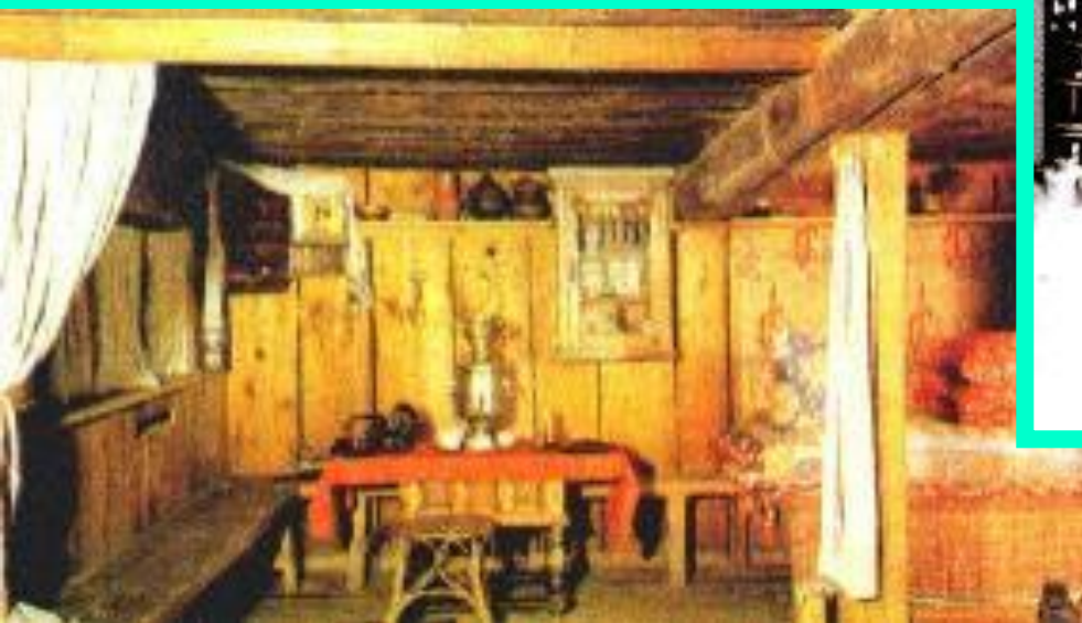
В доме рабочего.