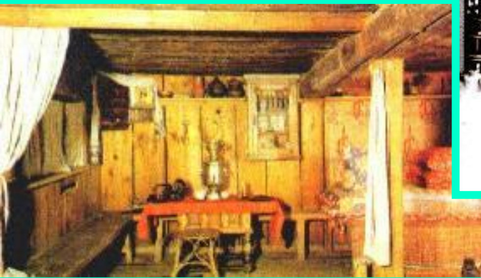
В доме рабочего.