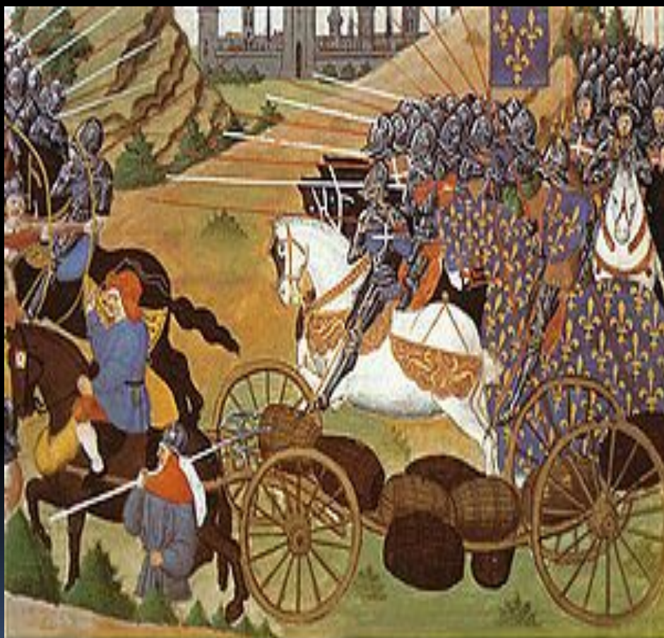
La bataille des "harengs" à Rouvray le 12 février 1429