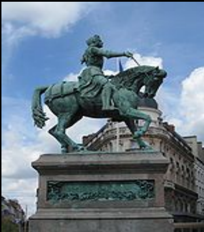
Памятник Орлеанской деде (1855) на центральной площади Орлеана