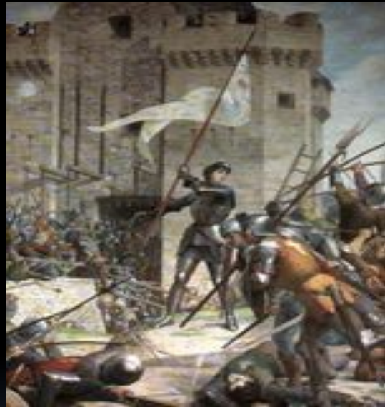
Жанна д'Арк при осаде Орлеана.

После того, как не было найдено ничего, что могло бы бросить тень на репутацию девушки, Карл решился передать в её руки командование войсками и назначил её главнокомандующим