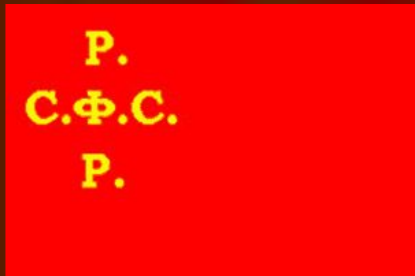
Флаг 1917 года