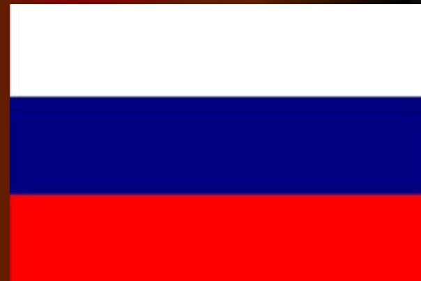
Флаг при Петре I