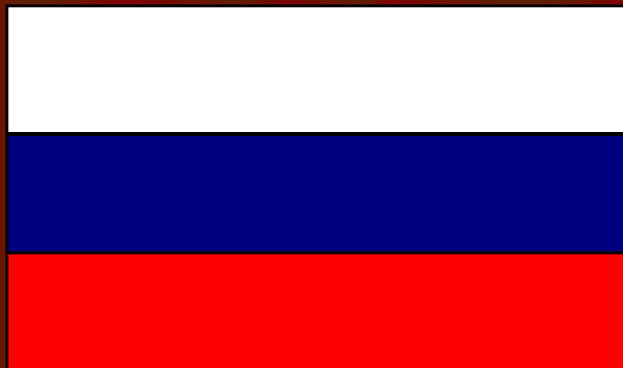
Флаг России с 25.12.00