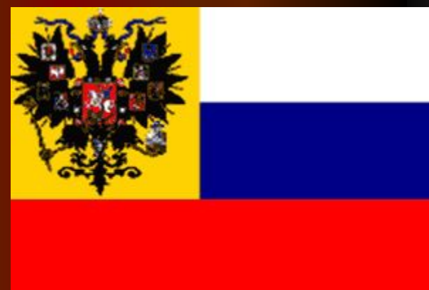
Флаг при Александре III. 1883 г.

Первое изображение флага Дмитрия Донского