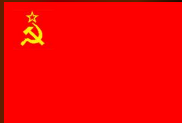
Флаг 1924 г.