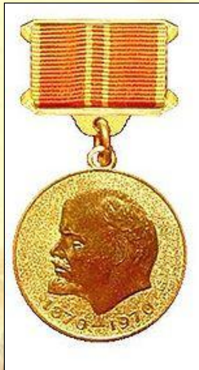
«Ветеран труда», «За доблестный труд»