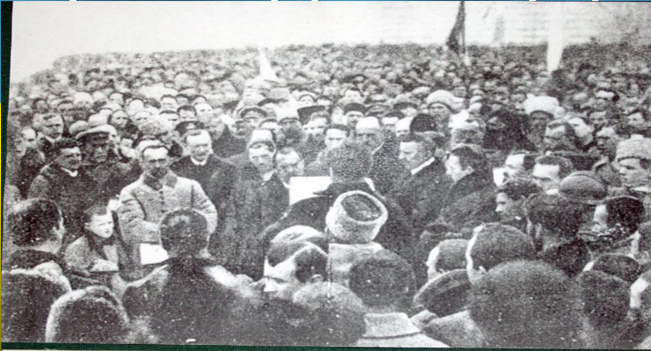
Мітинг на Софійському майдані у Києві з нагоди проголошення Акту злуки Української Народної Республіки та Західно-Української Народної Республіки в єдину соборну державу. 22 січня 1919 р.

7 листопада 1917 р. була проголошена Українська Народна Республіка, до складу якої увійшло 9 українських губерній.