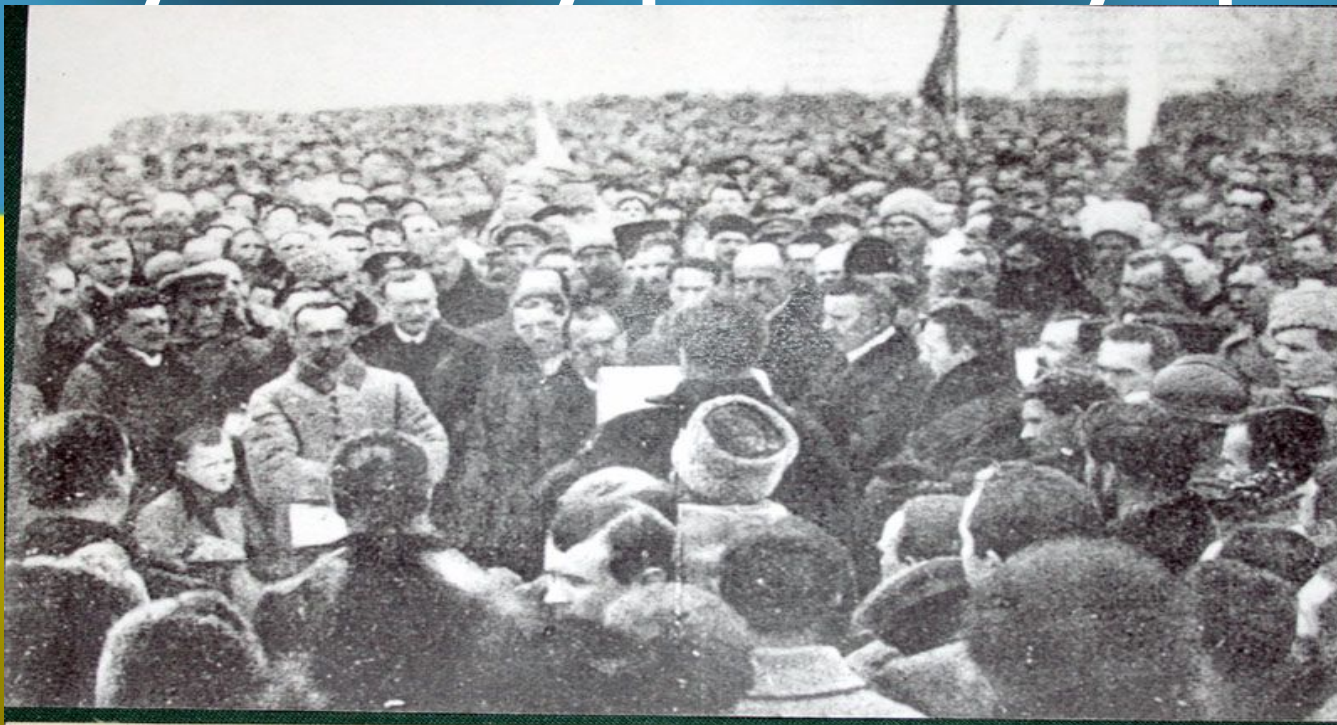
Мітинг на Софійському майдані у Києві з нагоди проголошення Акту злуки Української Народної Республіки та Західно-Української Народної Республіки в єдину соборну державу. 22 січня 1919 р.

7 листопада 1917 р. була проголошена Українська Народна Республіка, до складу якої увійшло 9 українських губерній.