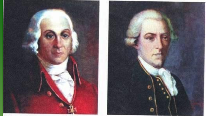
П. Паллас и И. Лепехин. Художник М. Шанин