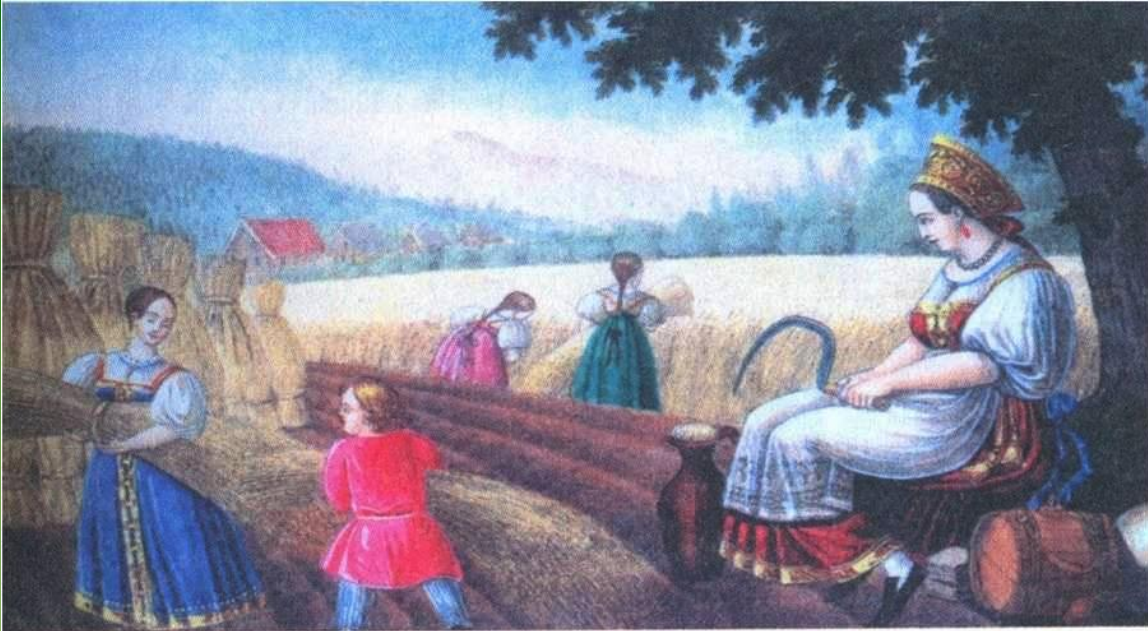
Жатва. Художник П. Вдовичев