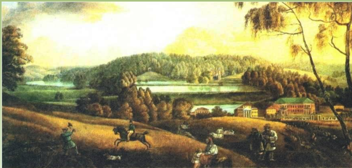
Дворянская усадьба. Картина XIX в.