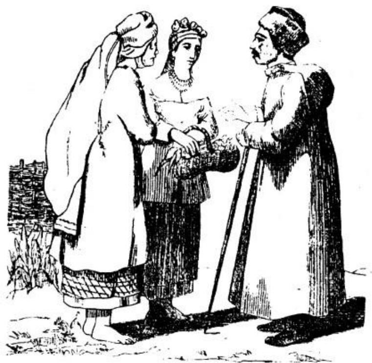
Одежда простолюдинов в Малороссии