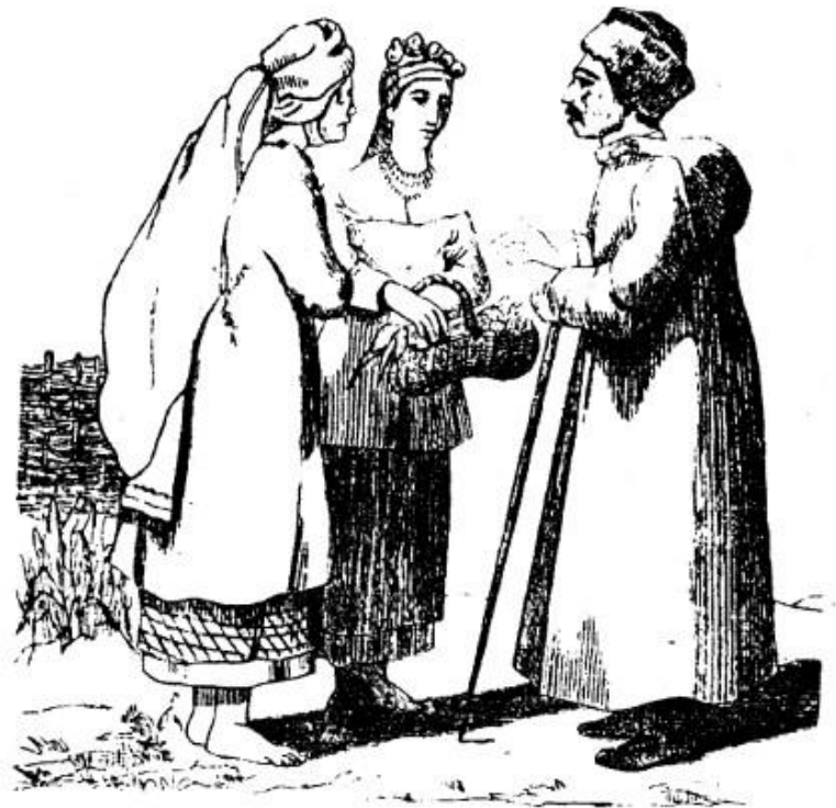
Одежда простолюдинов в Малороссии