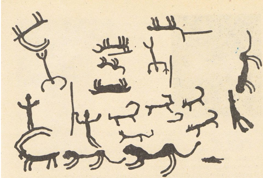
Наскальное изображение, найденное в одной из пещер марза Сюник, Армения