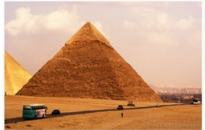
Пирамида Хеопса, Египет