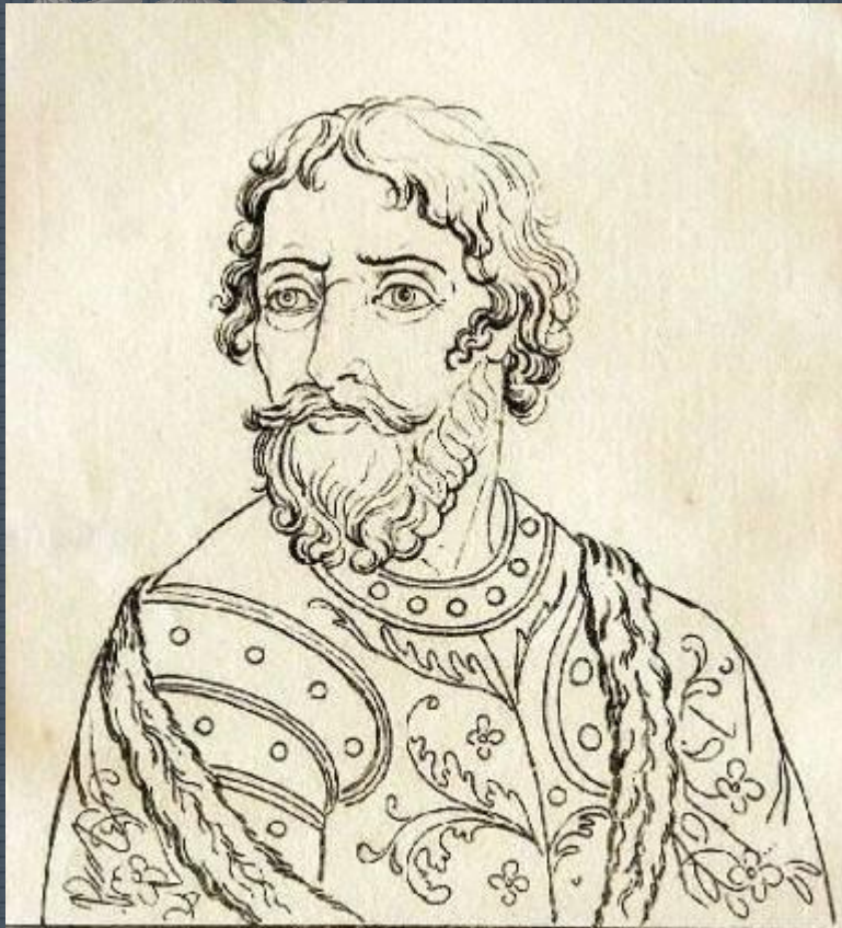
IVAN III, VASSILIÉVITCH.

Тяжкие думы терзали Великого князя Ивана Васильевича. Не новью были для него государственные дела после смерти отца. С 11 лет Иван был «глазами отца». Но тогда был рядом, поддерживал, а теперь Русь на его плечи легла, да грузом нелёгким. Как всю объять взором, ничего не упустить? На решение каких проблем прежде всего направить свои силы?