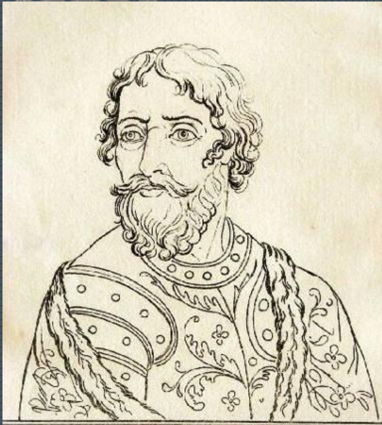
IVAN III, VASSILIÉVITCH.

Тяжкие думы терзали Великого князя Ивана Васильевича. Не новью были для него государственные дела после смерти отца. С 11 лет Иван был «глазами отца». Но тогда был рядом, поддерживал, а теперь Русь на его плечи легла, да грузом нелёгким. Как всю объять взором, ничего не упустить? На решение каких проблем прежде всего направить свои силы?