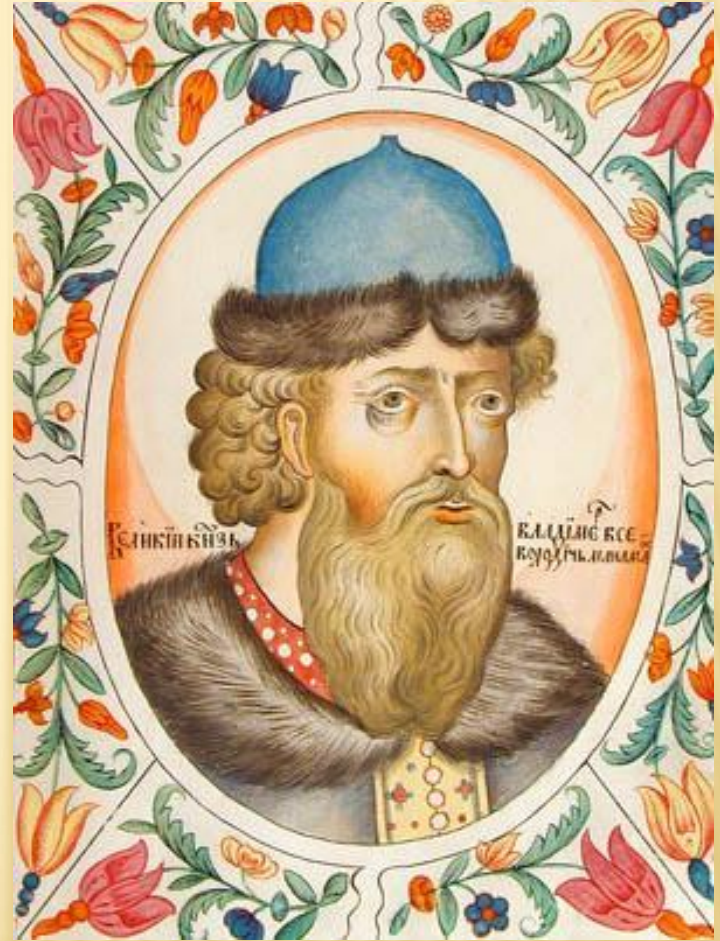
Великий князь Владимир Всеволодович Мономах. Портрет из царского титулярника. 1672 год