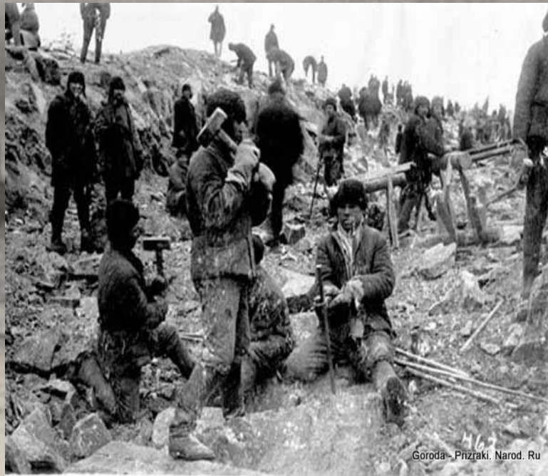
Goroda - Prizraki. Narod. Ru

С НОЯБРЯ 1934 Г. ПРИ НАРКОМЕ ВНУТРЕННИХ ДЕЛ БЫЛО ОБРАЗОВАННО ОСОБОЕ СОВЕЩАНИЕ. ОНО НАДЕЛЯЛОСЬ ПРАВОМ В АДМИНИСТРАТИВНОМ ПОРЯДКЕ, В ОТСУТСТВИИ ОБВИНЯЕМОГО, БЕЗ УЧАСТИЯ СВИДЕТЕЛЕЙ, ПРОКУРОРА И АДВОКАТА ОТПРАВЛЯТЬ «ВРАГОВ НАРОДА» В ССЫЛКУ ИЛИ В ИСПРАВИТЕЛЬНО-ТРУДОВЫЕ ЛАГЕРЯ НА СРОК ДО ПЯТИ ЛЕТ.