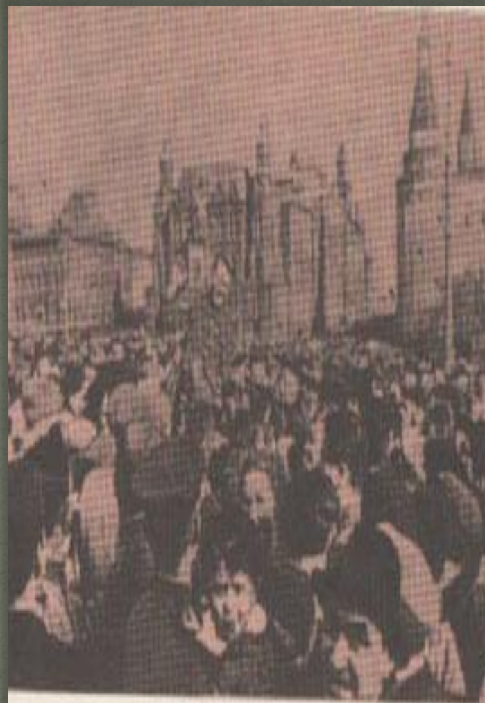
9 мая 1945 г. на Красной площади.

День Победы, как он был от нас далек, Как в костре потухшем таял уголек. Были версты, обгорелые, в пыли,— Этот день мы приближали как могли.