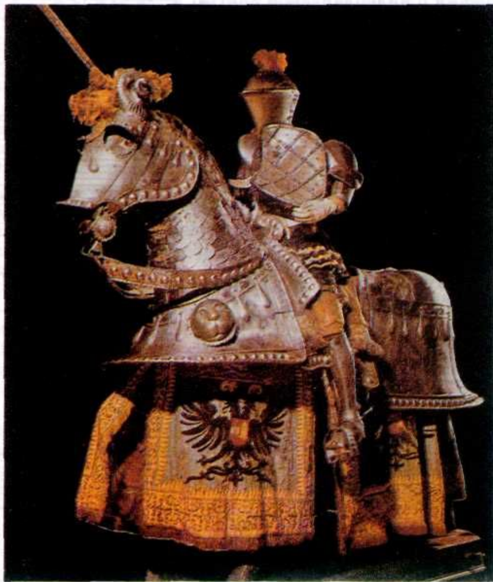
Доспехи Карла V.