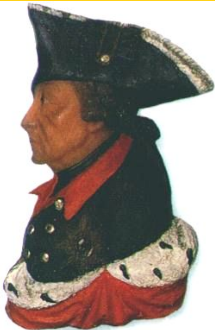
Фридрих II— Король Пруссии.

Международные отношения в 18 в. Были очень запутанными и противоречивыми. Пруссия, возглавляемая Фридрихом II Великим на чала захватнические войны. В ходе борьбы за австрийское наследство (1740-1748) Фридрих захватил Силезию и стремился подчинить Саксонию, Чехию, часть Польши. Он полагал что ослабшая Франция не станет мешать.