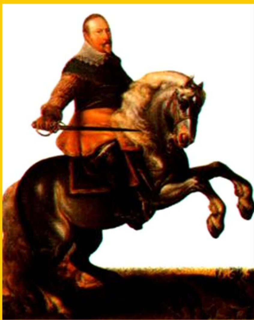
Густав Адольф II

Вскоре в Германию вторглись шведы и в 1632 г. Густав Адольф II разбил католиков, но сам погиб.