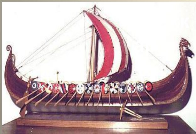
ВИКИНГИ В ЕВРОПЕ, VIII - XII ВВ.