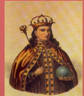
Двойной трон - Иван и Петр регентша