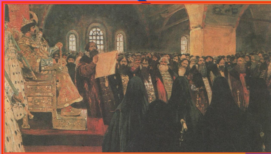
С.В. Иванов «Земский собор»