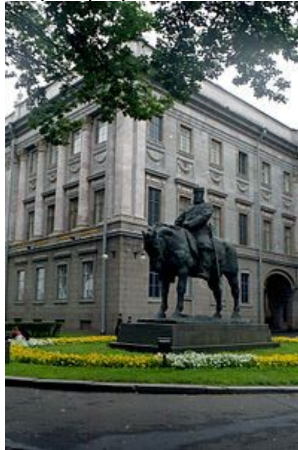
Паоло Трубецкой. Памятник Александру Третьему.