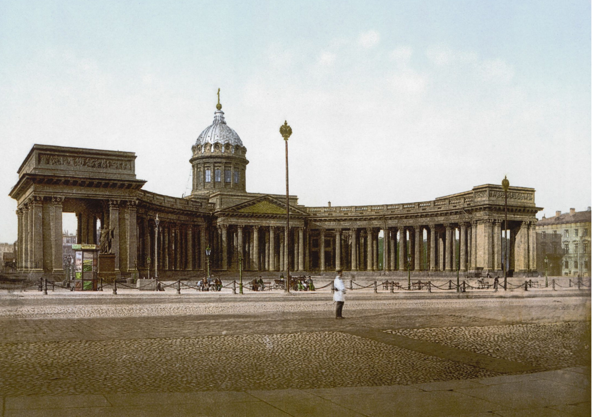
920. P. Z. - ST. PETERSBOURG. LA CATHÉDRALE DE KASAN.