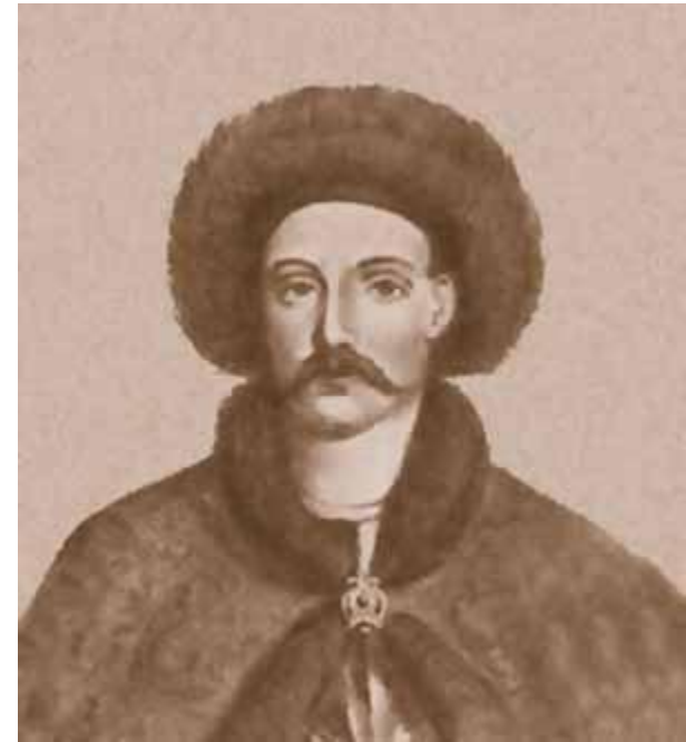
Всеволод в Переяславле