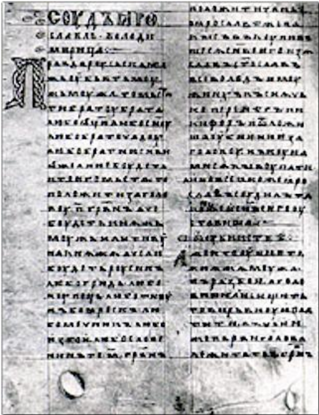
В р/т стр.28 №4.