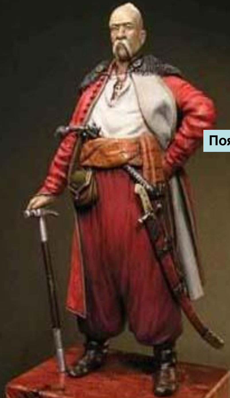
Пояс / кушак