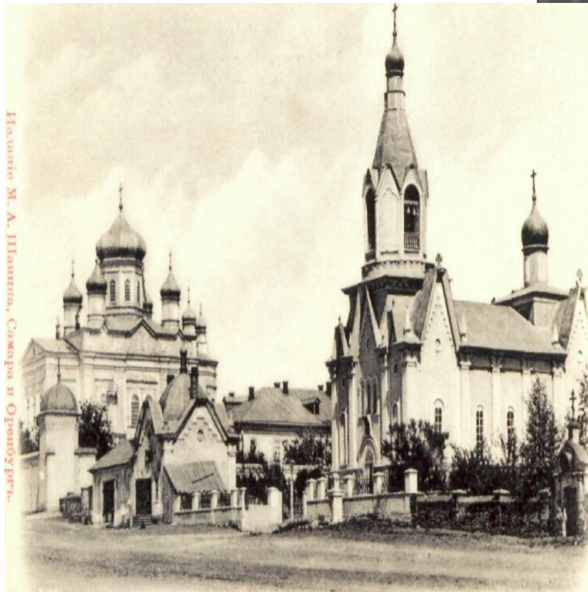
Издание М. А. Шапша, Самары и Оренбурга.

Монастырь находился рядом с христианским кладбищем (ныне севернее ул. Аксакова, восточнее ул. Маршала Жукова). До наших дней сохранились несколько зданий и построек (в измененном виде, ул. Аксакова 14, 16, 16а, ул. Маршала Жукова, 50 и др.). В левой части снимка виден южный фасад Успенского собора. Справа — Кладбищенская церковь во имя Смоленской Богоматери