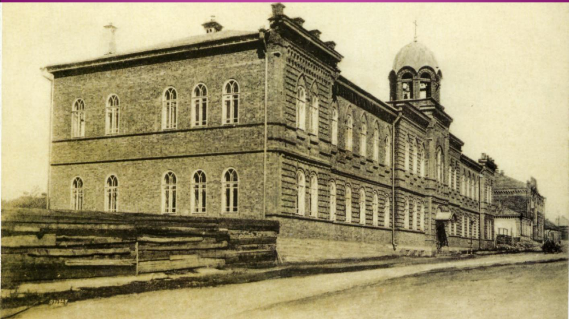
Мужское духовное училище