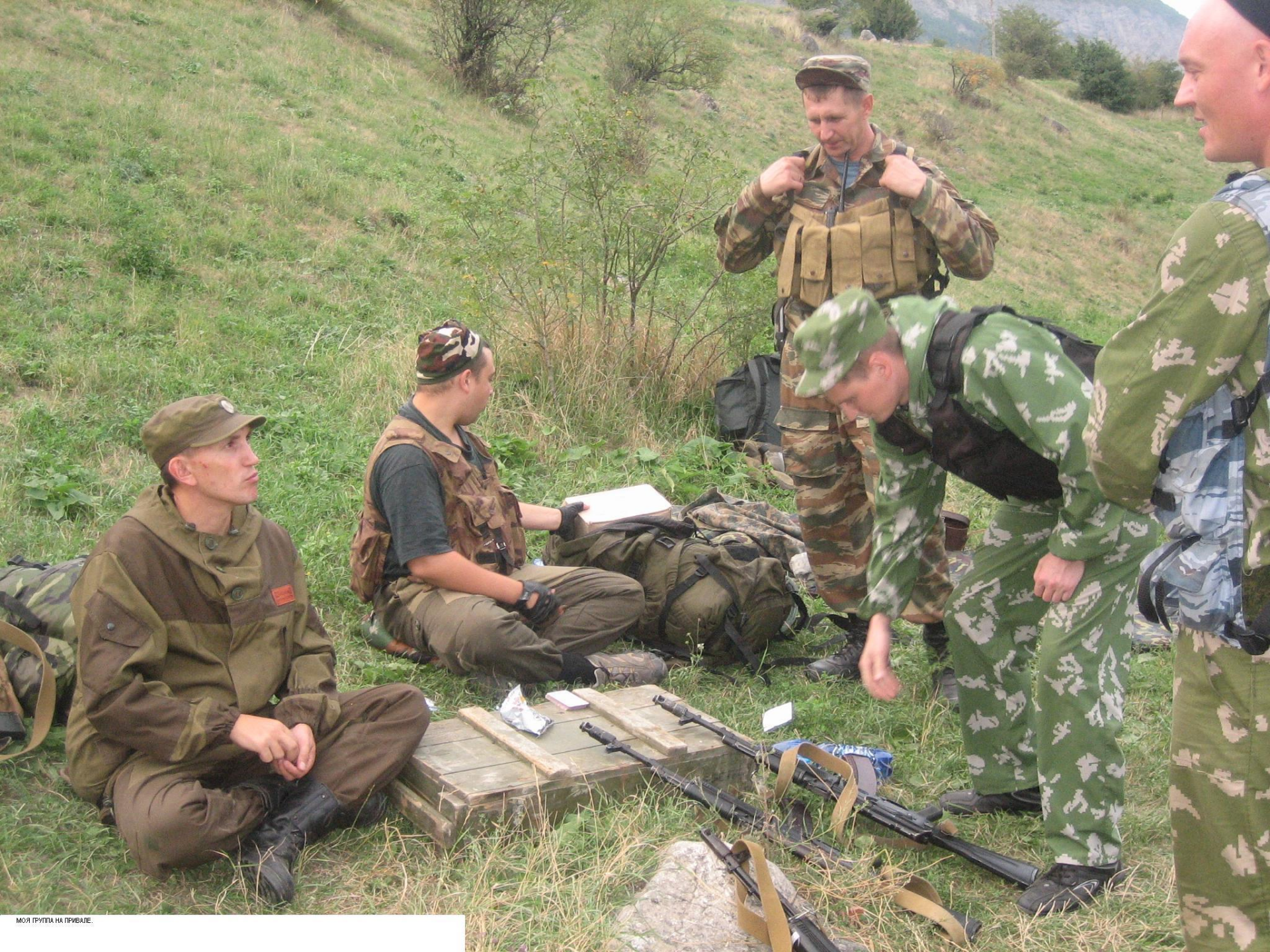
МОЯ ГРУППА НА ПРИВАЛЕ.