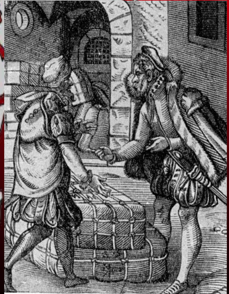
Купцы. Гравюра И. Аммана