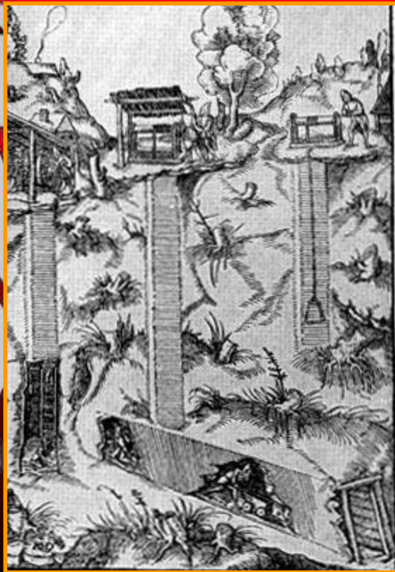
Шахта в разрезе. Гравюра из книги Г.Агриколы 'О металлах' 1556 г.