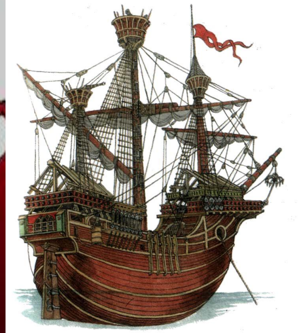
Многопалубные каракки имели три мачты с разными парусами