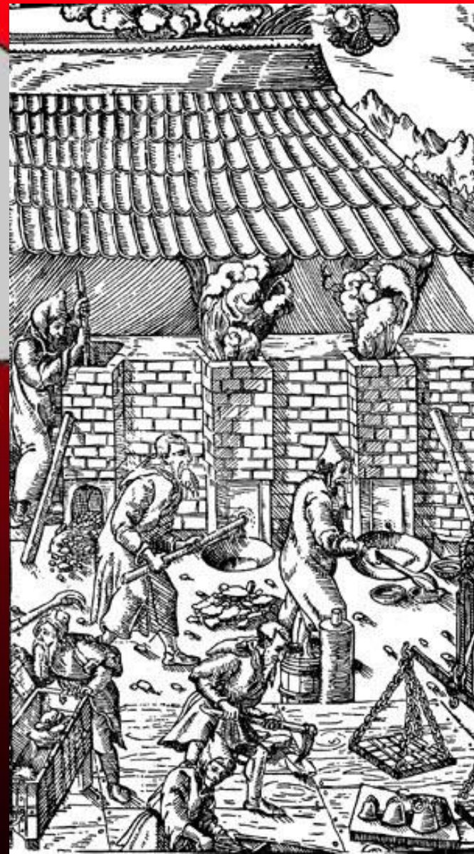
Доменные печи. Гравюра из книги Г. Агриколы 'О металлах' 1556 г.