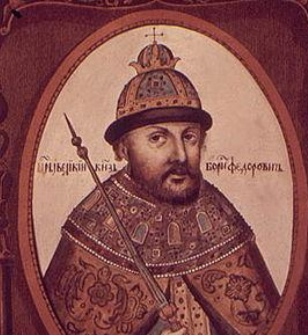
Борис Годунов ПРАВИТЕЛЬ