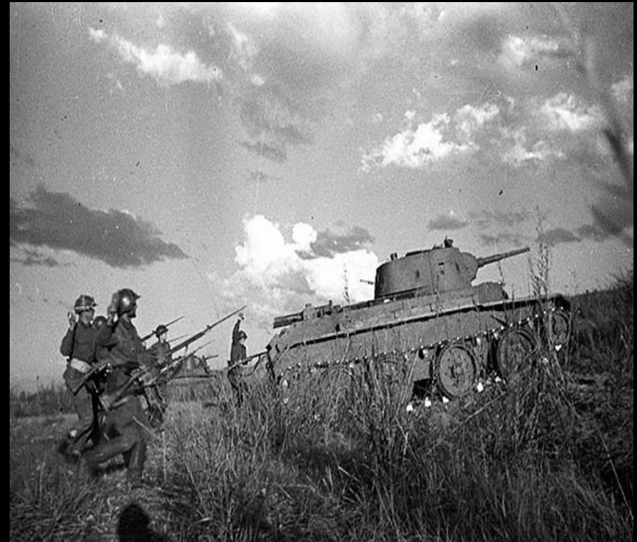
1938 г. – конфликт на оз. Хасан