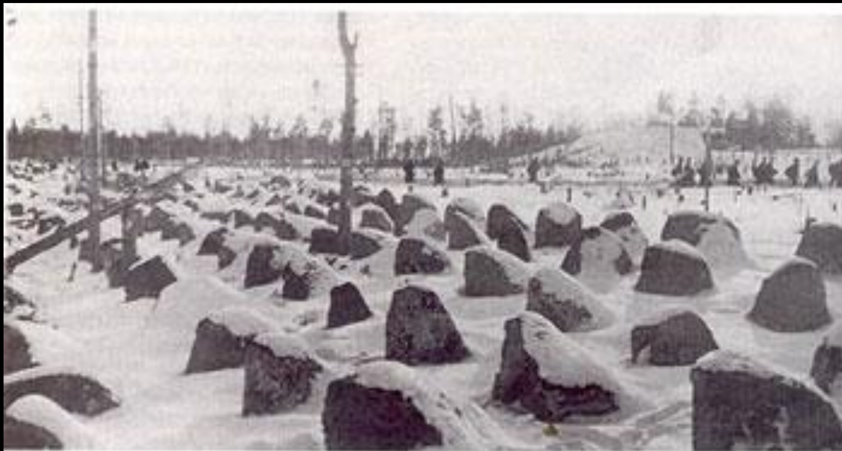
Противотанковые надолбы на линии Маннергейма

В итоге к началу осени было возведено несколько сот новых ДОТов, ДЗОТов, сотни километров траншей, окопов, бетонных надолбов.