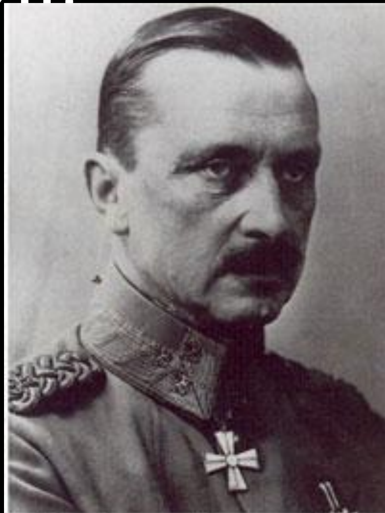
Карл Густав Маннергейм