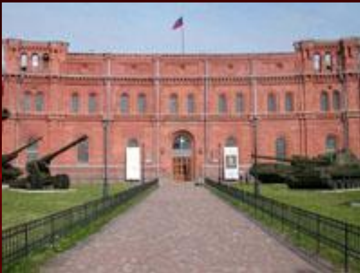
Музей истории вооруженных сил России г. Ленинград