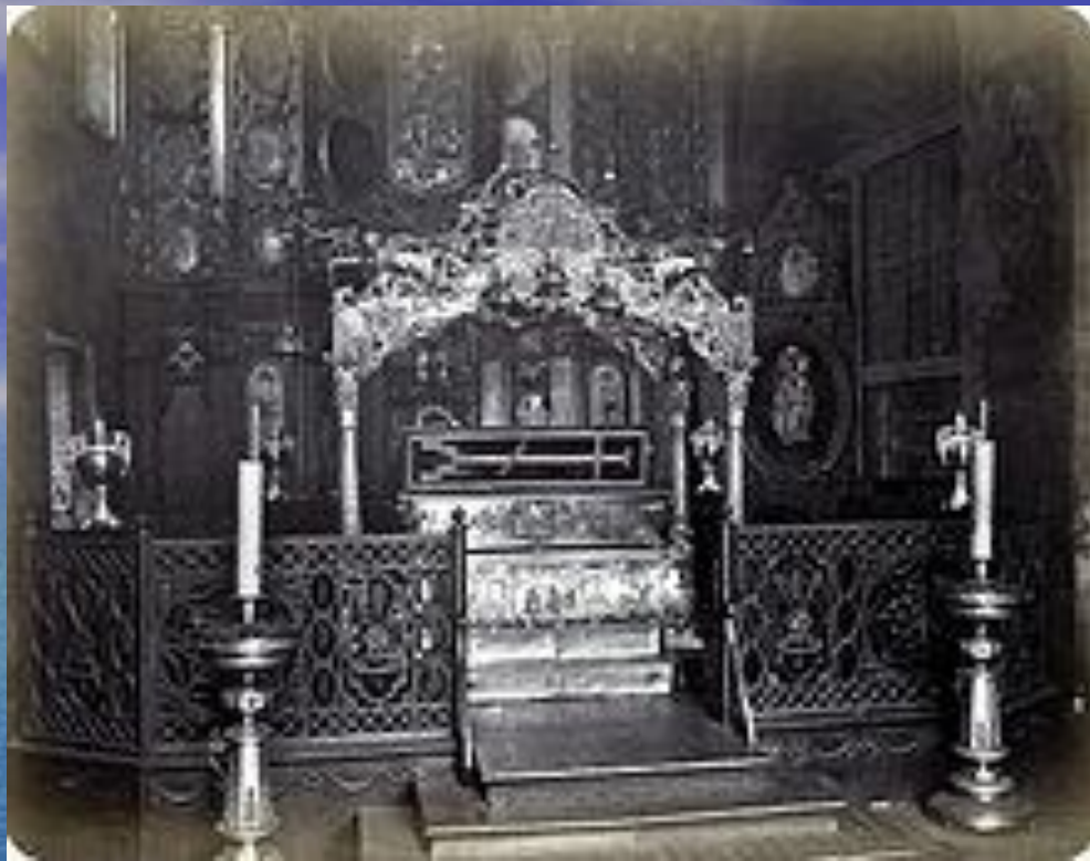
Рака с мощами св. Варвары в Златоверхом монастыре, фото 1872 года