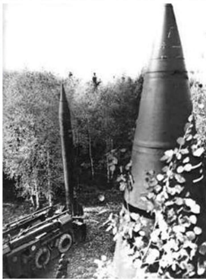
Ракеты средней дальности.

В сер.60-х гг.руководство страны поставило задачу достичь военно-стратегического паритета с США.На вооружение начала поступать новейшие техника и ядерное оружие.Роль Генералитета и руководства ВПК резко выросла.В 1976 г. Министром обороны стал член Политбюро Д.Ф.Устинов,возглавлявший долгие годы различные отрасли военного производства.