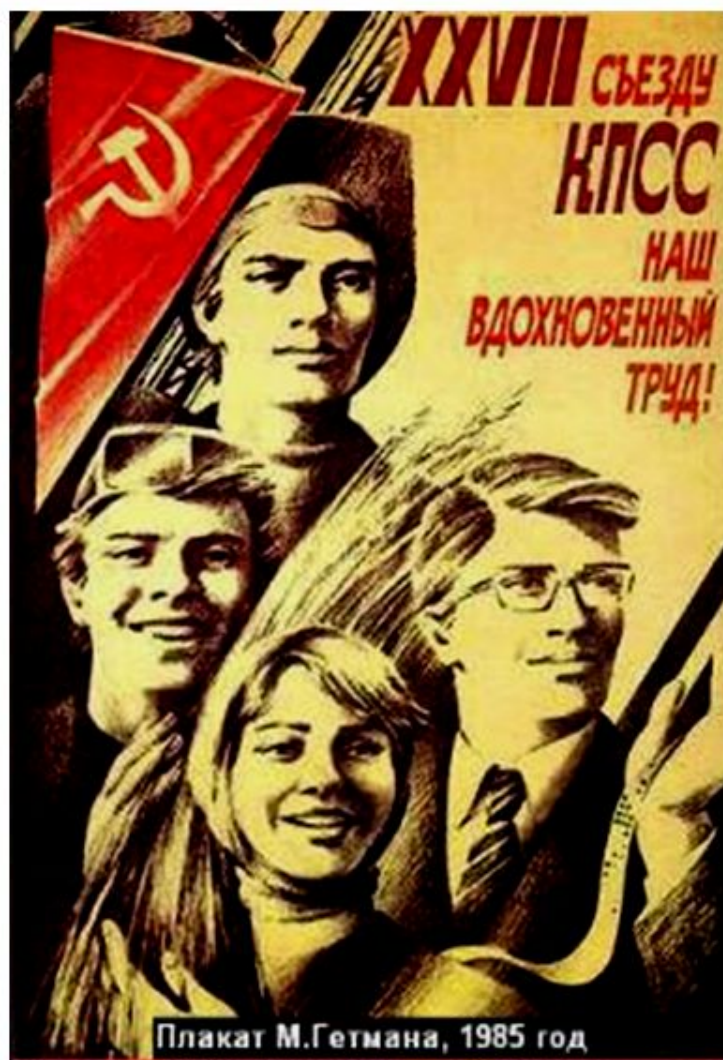
Плакат М.Гетмана, 1985 год

В 1986 г. на XVII съезде КПСС был рассмотрен проект новой редакции партийной программы. Задача построения коммунизма была объявлена несвоевременной, ставилась цель совершенствования социалистического общества. Трудовые коллективы должны были стать «первичными ячейками демократии», Впервые руководство заявило о необходимости «гласности».