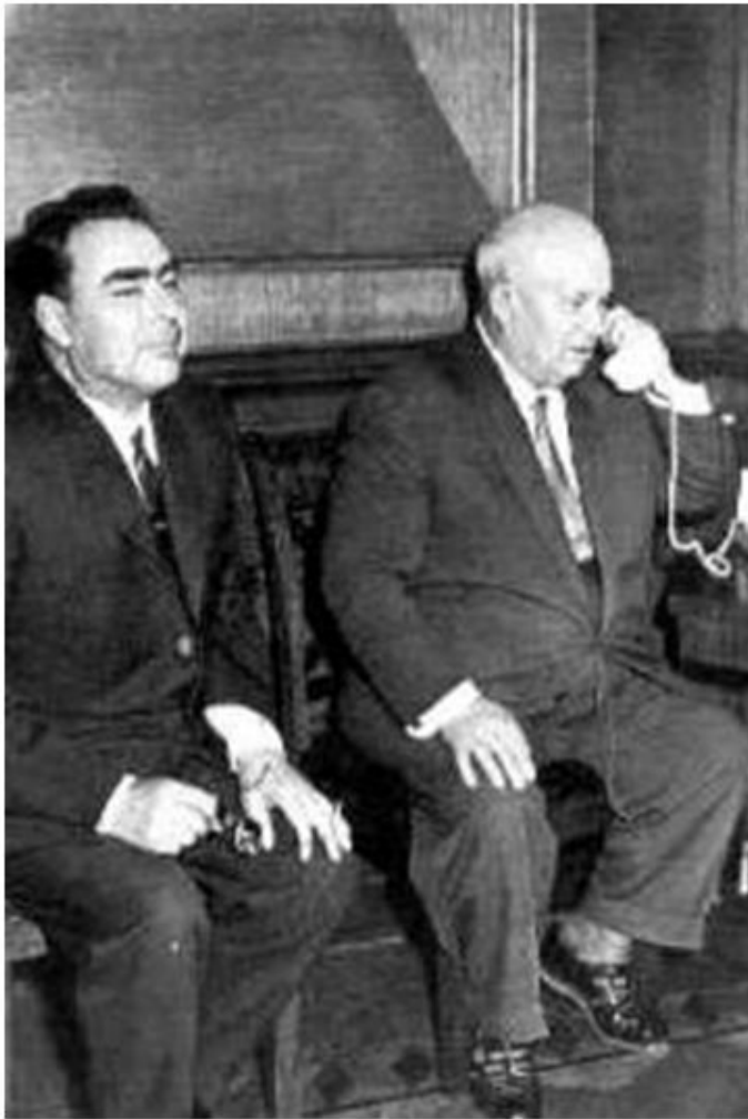
Л.Брежнев и Н.Хрущев на сеансе связи с космонавтами.

Непоследовательность Н. Хрущева, частые перетряски в аппарате, его нежелание прислушиваться к мнению других членов высшего руководства привели к складыванию против него заговора части партийного и государственного аппарата. В октябре 1964 г. Н. Хрущев был отправлен на пенсию. Генеральным секретарем ЦК КПСС стал Л. И. Брежнев, а Председателем Совета Министров - А. Н. Косыгин.