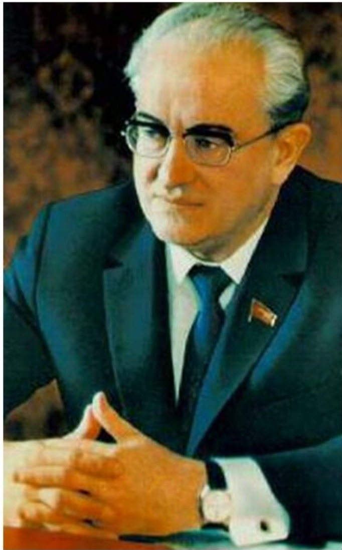
Ю. В. Андропов.

В ноябре 1982 г. во главе страны встал Ю. Андропов. Он был образован, бескорыстен, аскетичен, умел располагать людей к себе. В то же время он был типичным представителем партийной номенклатуры. Возглавляя в течение 15 лет КГБ он, как никто другой имел реальное представление о положении дел в стране. Ю. Андропов сделал ставку на «молодежь». При нем резко возвысился М. Горбачев, появились в высшем руководстве страны Е. Лигачев и Н. Рыжков.