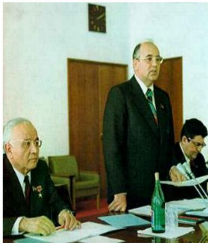
М.С.Горбачев выступает на заседании контрольной комиссии.

При Ю.В.Андропове Горбачев занимался не только сельским хозяйством, но и широким кругом вопросов как внутренней, так и внешней политики. Несмотря на сопротивление консерваторов он стал при К.У.Черненко вторым человеком в партии.