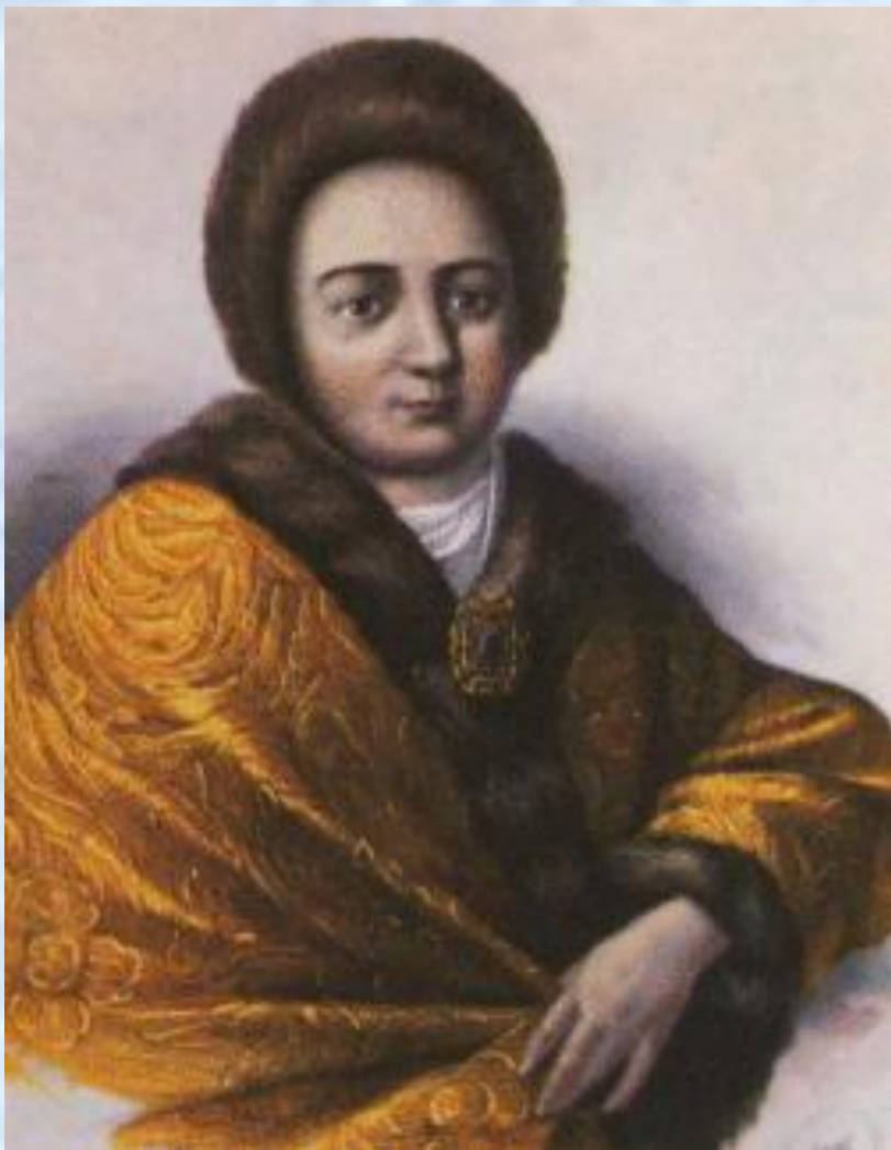
Наталья Кирилловна Нарышкина

Появилась портретная живопись – создавались парсуны