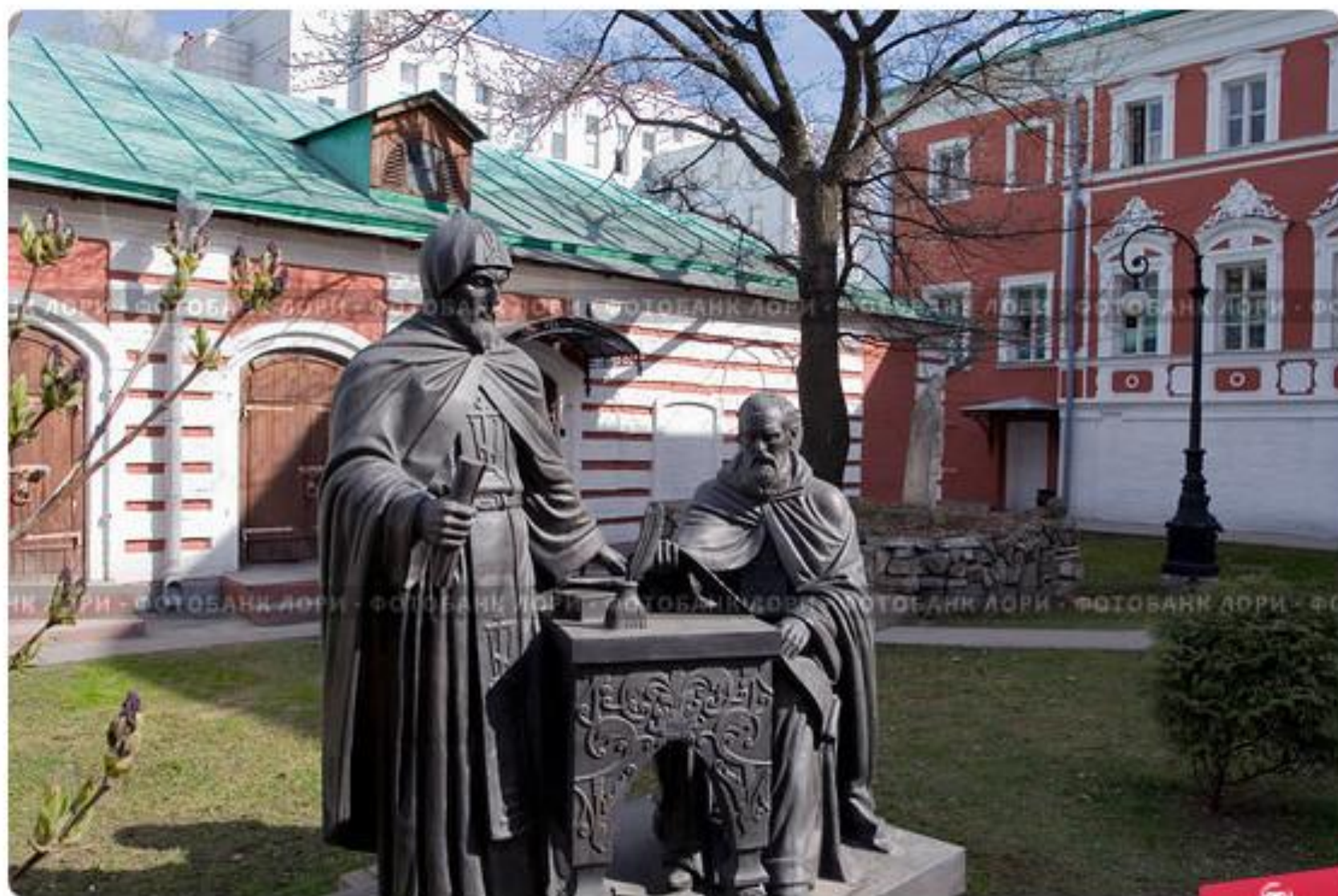
Основатели славяно-греко-латинской академии братья Лихуды. Скульптор В.Клы