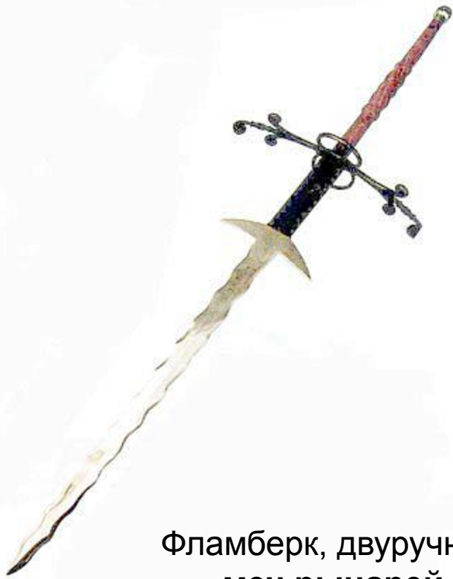
Фламберк, двуручный меч рыцарей средневековья.

Помимо копья рыцарь был вооружён железным мечом. С X в. Мечи - массивные и длинные до метра. Мечи с полукруглым набалдашником и прямой крестовиной. Мечам давали прозвища (у Роланда - Дюрандаль, а у короля Артура - Эскалибур). Рукояти мечей украшали драгоценными камнями. Их передавали по наследству, о них складывались легенды.