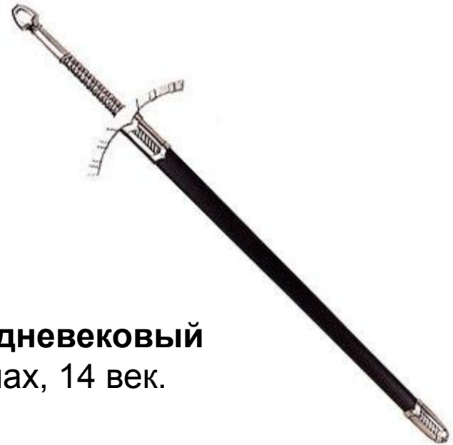
Меч средневековый в ножнах, 14 век.