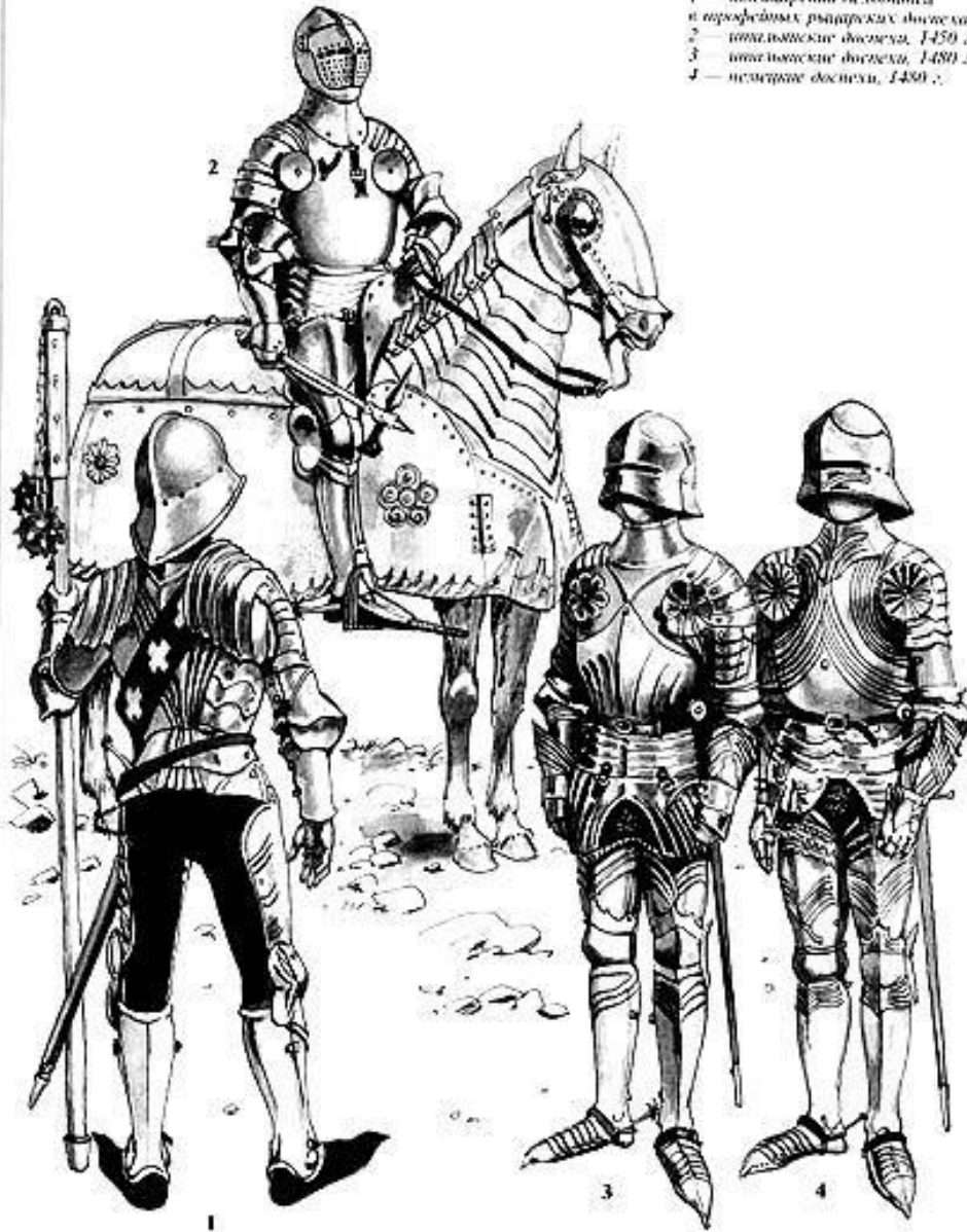
Рыцари XV в.: 1 — швейцарский пехотинец в трофейных рыцарских доспехах, 2 — итальянские доспехи, 1450 г., 3 — итальянские доспехи, 1480 г., 4 — немецкие доспехи, 1480 г.

1 - Швейцарский пехотинец в трофейных рыцарских доспехах