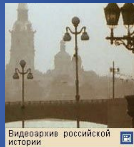
Видеоархив российской истории