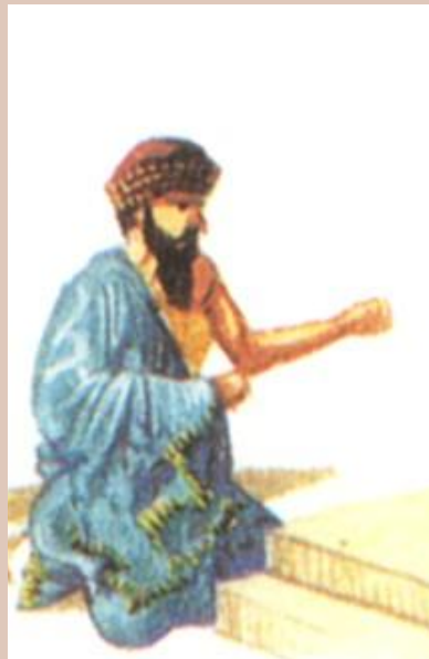
Человек убивший вола