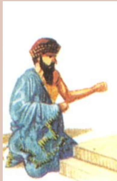
Человек убивший вола