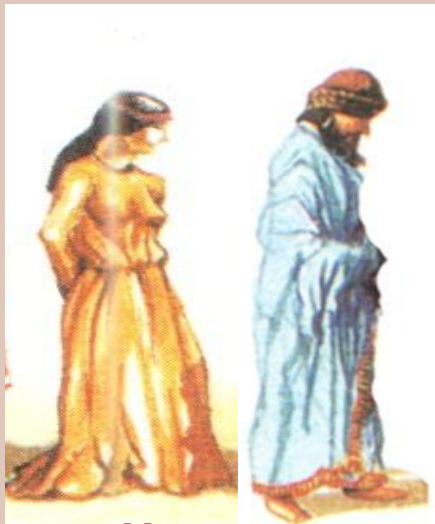
Человек, укрававший одежду богини Иштар из храма