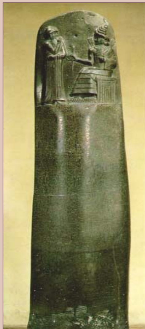
Столб с текстом законов царя Хаммурапи.