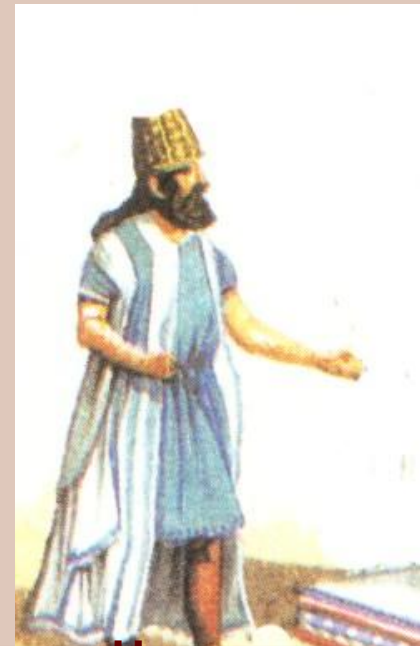
Человек, укрававший беглого раба