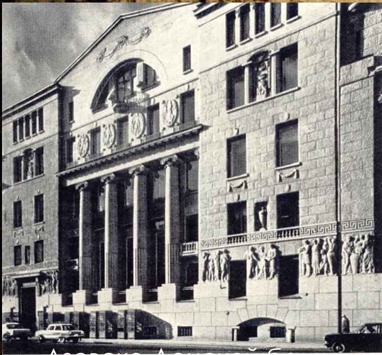
Азовско-Донской банк в Петербурге

Русская архитектура в начале XX века переживает последний период своего расцвета, связанный с появлением стиля модерн . Его создатели стремились максимально учесть те возможности, которые представляют новые строительные конструкции и материалы (бетон, сталь, стекло), и в то же время эстетически осмыслить их, придать им художественную выразительность.