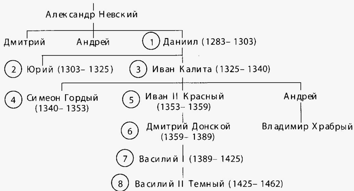
Рис. 3. Генеалогическое древо московских князей (в скобках даны даты правления)