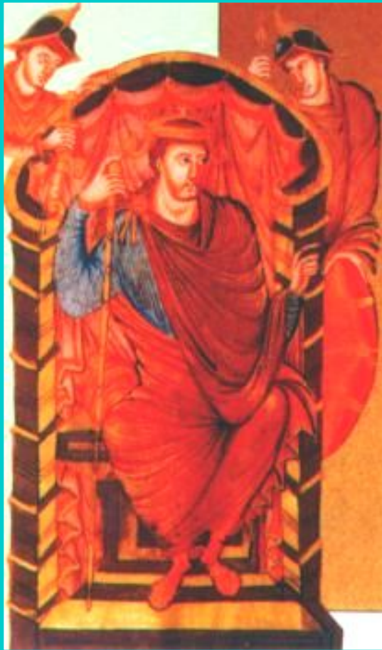
Карл Мартелл. Средневековая миниатюра

В 732 г. Мартелл разбил у г. Пуатье арабов завоевавших Испанию.