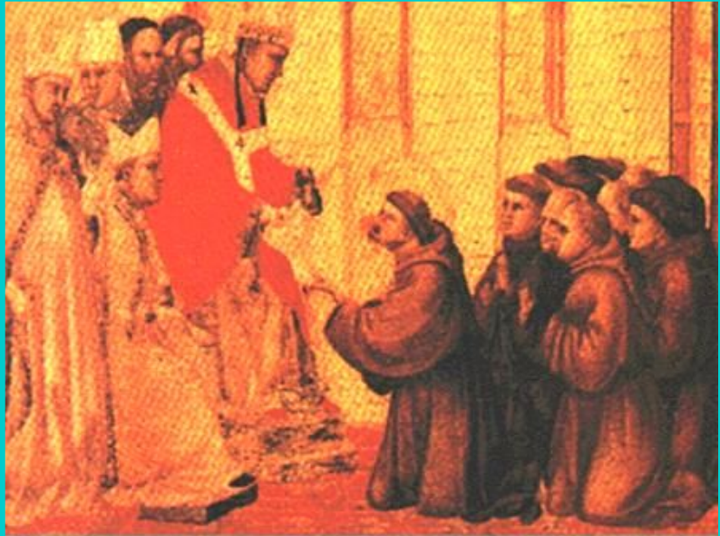
Монахи на приеме у короля франков.

В 751 г. у франков появилась новая династия- Каролинги . Сын Карла Мартела-Пипин Короткий получил власть от папы-тот решил, что королем должен быть тот, у кого есть реальная власть, а не тот у кого-корона.