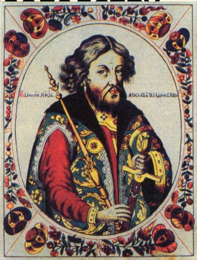
Великий князь Ярослав I Владимирович Мудрый.

Форма правления - монархия это государство, в котором власть передается по