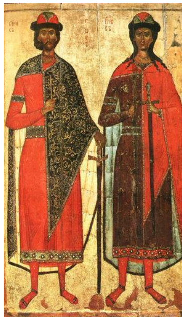
Борис и Глеб

Святополк, поддержанный киевлянами убивает Бориса и Глеба. Занимает Киевский престол