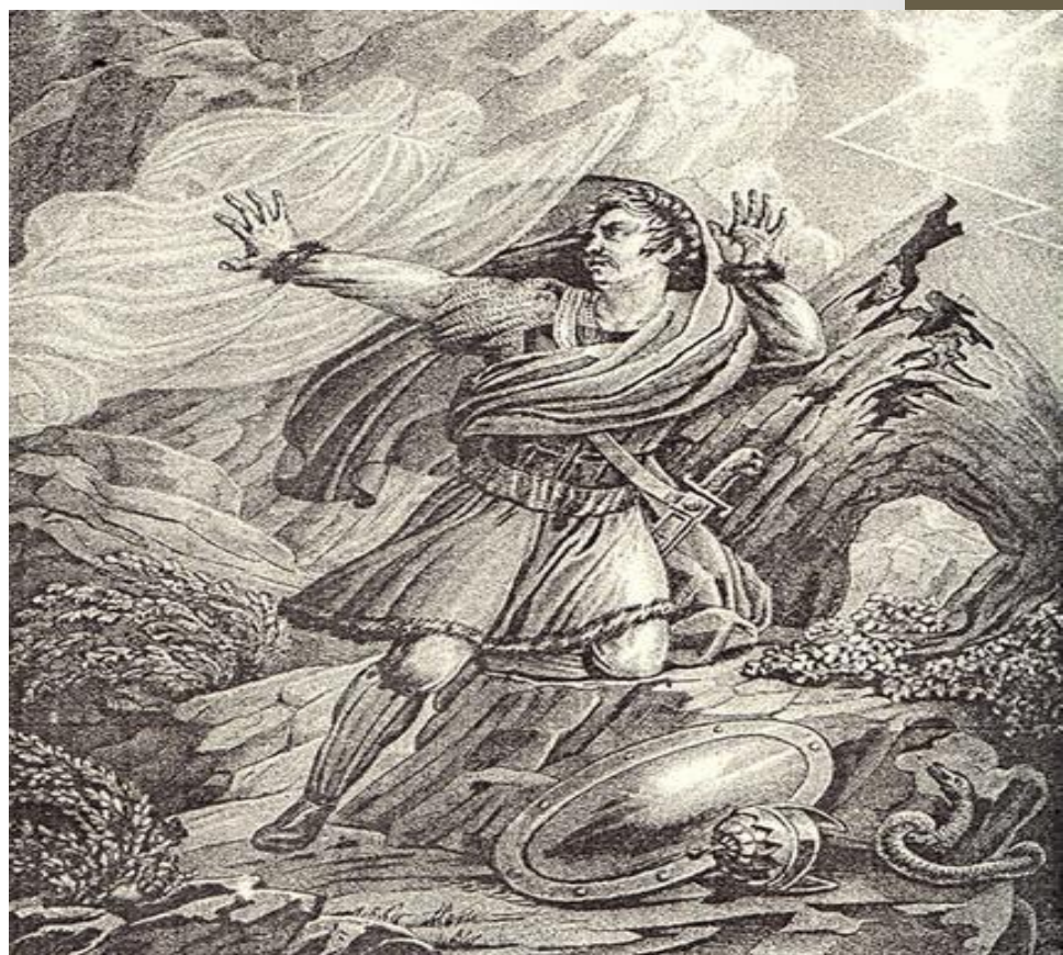
Бегство Святополка. Художник – Б.А. Чериков