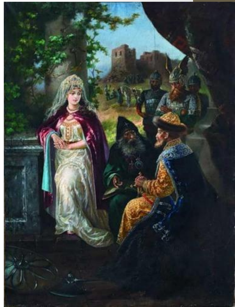
Ярослав Мудрый и шведская принцесса Ингигерда