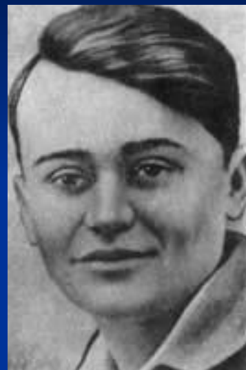
Молодогвардеец Олег Кошевой.