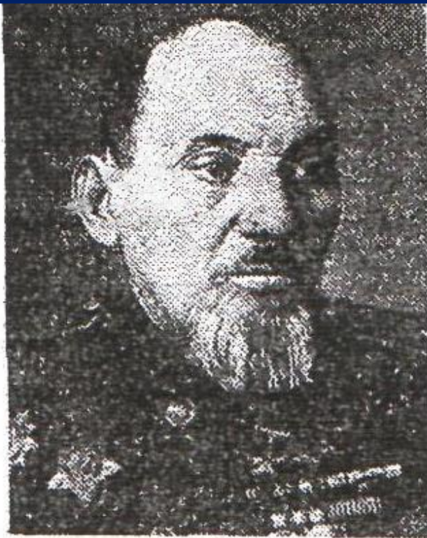
С. А. Ковпак.