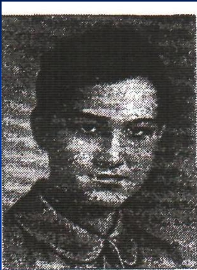
З. А. Космодемьянская.