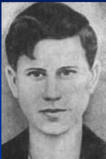
Молодогвардеец Сергей Тюленин.